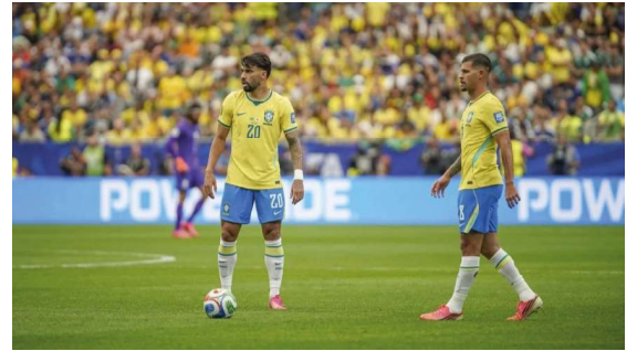
Meio-campista da Seleção Brasileira foi diagnosticado com problema na coxa esquerda após jogo contra o Japão.

Classificado para as oitavas de final, o Brasil aguarda a definição do adversário, que sairá do confronto entre Costa do Marfim e Noruega. A partida está marcada para o