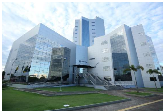
Maioria dos atuais deputados deve disputar a reeleição, enquanto novos nomes buscam espaço no Legislativo estadual.

Analistas políticos avaliam que a força eleitoral dos deputados que buscam a reeleição tende a dificultar uma renovação ampla.