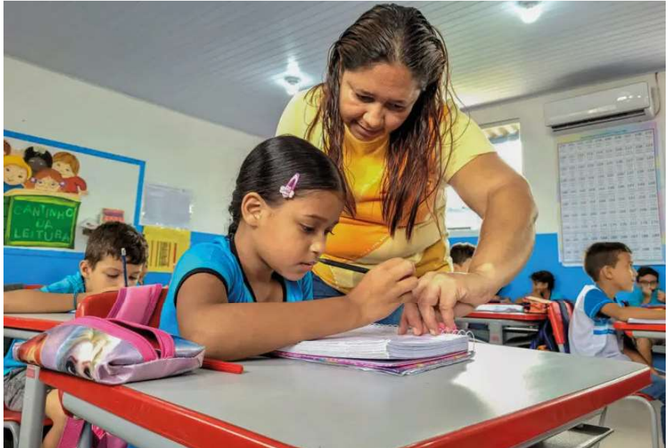
O resultado colocou Rondônia na 4ª posição do ranking nacional de alfabetização.