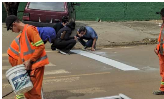
Projetos de sinalização viária do Detran-RO leva mais organização e fluidez ao trânsito nos municípios; o recurso será integralmente destinado à execução das intervenções nas ruas da cidade.