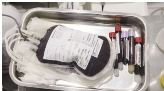
Pesquisa desenvolvida por especialistas de Rondônia foi premiada em congresso de saúde.

Com o objetivo de melhorar a qualidade das informações e ampliar a segurança dos pacientes, a Agevisa/RO está desenvolvendo novas diretrizes para fortalecer a he-