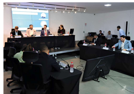
Decisão acompanha medidas adotadas por governos e órgãos públicos em todo o país.

Com a aprovação da LDO, o Poder Executivo passa a elaborar a proposta da Lei Orçamentária Anual (LOA), que especificará os valores destinados a cada secretaria, programa, obra e ação governamental prevista para 2027. O projeto