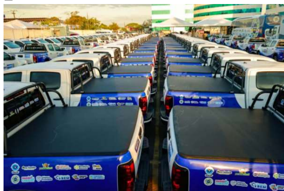
A entrega contemplou 83 veículos destinados às unidades do CRAS E CREAS.

Para ampliar e intensificar a capacidade de atendimento às famílias em situação de vulnerabilidade social, melhorar a estrutura dos municípios e garantir mais eficiência na execução dos serviços socioassistenciais, o governo de Rondônia, por meio da Secretaria de Estado da Assistência e do Desenvolvimento Social (Seas) realizou, nesta segunda-feira (29), a solenidade de entrega de veículos e kits tecnológicos destinados à ampliação e aprimoramento das políticas de