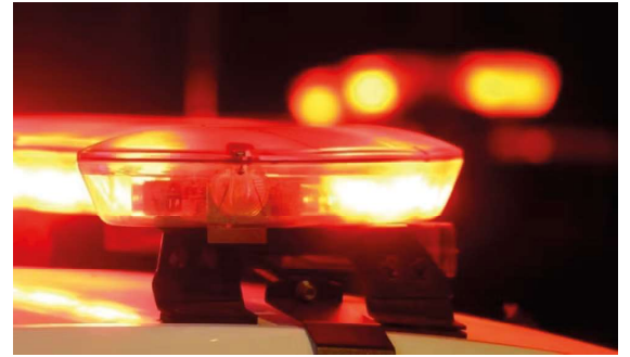
Dois homens armados invadiram a residência e efetuaram diversos disparos. A Polícia Civil aponta ligação com um duplo homicídio registrado no último sábado (27).

caso para esclarecer as circunstâncias dos crimes e identificar todos os envolvidos.