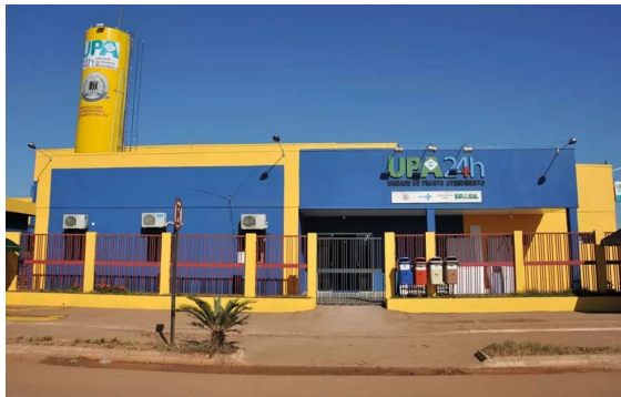
Vítima estava em casa, na zona leste de Porto Velho, quando ouviu estampidos e, pouco depois, percebeu que havia sido atingida por um tiro na perna.

Uma mulher foi baleada dentro de casa enquanto assistia ao jogo da Seleção Brasileira, na tarde desta segunda-feira (29), na zona leste de Porto Velho. A vítima foi atingida por um disparo na perna e, inicialmente, acreditou que os estampidos eram fogos de artifício.