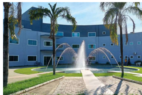
A decisão foi proferida nesta terça-feira (30) pela 1ª Vara Cível da Comarca de Ariquemes.

Ainda conforme a Secretaria de Saúde, os serviços prestados à população seguem funcionando normalmente, sem qualquer impacto decorrente da ação judicial.