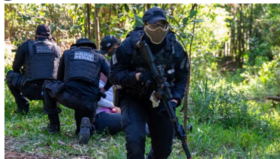
Capacitação realizada em Porto Velho ensinou técnicas de atendimento a feridos em ambientes de alto risco.