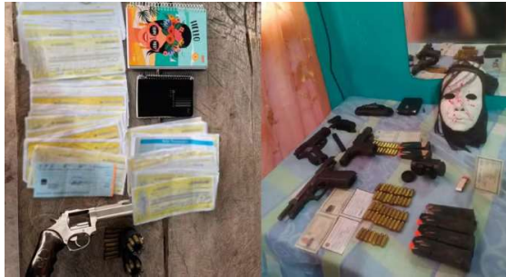
Objetos apreendidos durante Operação Soldados da Usura em RO – Foto: MP-RO.

A sentença também determinou a perda dos cargos públicos dos policiais militares envolvidos, por entender que a conduta praticada é incompatível com o exercício da