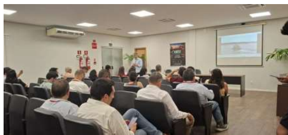
A iniciativa reuniu empresários e representantes dos setores produtivos do Peru, que conheceram a estrutura operacional e o potencial logístico do Porto de Porto Velho.

Integrantes da Missão Comercial e Logística Brasil-Peru 2026 visitaram, na quarta-feira (24), o Porto Organizado de Porto Velho para conhecer a estrutura e o potencial logístico administrado pela Sociedade de Portos e Hidrovias do Estado de Rondônia (Soph).