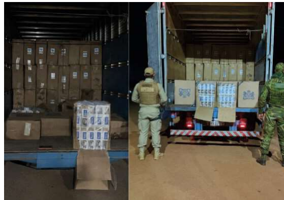
Motorista apresentou informações contraditórias durante abordagem na BR-364, e fiscalização encontrou 199 caixas de cigarros estrangeiros.

A apreensão foi realizada durante uma fiscalização de rotina em uma barreira policial instalada na BR-364, nas proximidades do entroncamento com a BR-425. Durante a abordagem a um caminhão, os policiais perceberam que a motorista demonstrava nervosismo e apresentava informa-