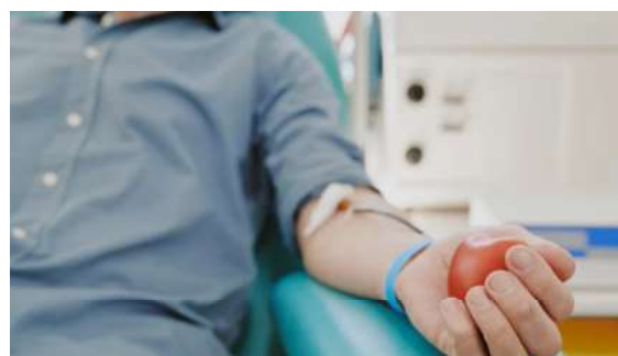
Ação busca fortalecer os estoques de sangue e incentivar a solidariedade entre os servidores e a população.

“A doação de sangue é um ato de solidariedade que gera um impacto direto na vida de quem precisa. Cada bolsa coletada pode ajudar a salvar até quatro vidas. A parceria com a PGE-RO tem sido essencial para fortalecer a cultura da