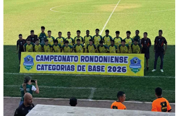
Competição reunirá atletas de cinco estados, distribuirá mais de R$ 50 mil em premiações e terá entrada gratuita nos dias 27 e 28 de junho.

Além da importância para a tabela de classificação, a competição representa uma oportunidade para que jovens atletas sejam observados por clubes de outras regiões do país. O desempenho no Estadual Sub-20 costuma abrir portas para negociações e para a continuidade da carreira no fu-