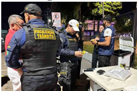
A ação resultou em 475 abordagens e 61 flagrantes de condutores dirigindo sob efeito do álcool.

Com o objetivo de reduzir sinistros e mortes no trânsito, o Departamento Estadual de Trânsito (Detran-RO) realizou, nos dias 19 e 20 de junho, a “Operação Lei Seca” nos municípios de Porto Velho, Ariquemes e Cacoal. A ação resultou em 475 abordagens e 61 flagrantes de condutores dirigindo sob efeito do álco-