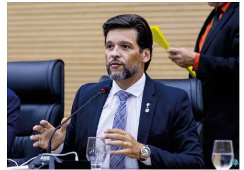
Proposta enviada pelo Governo de Rondônia diminui de 50% para 10% o repasse de multas fiscais.

explicar objetivamente onde pretende aplicar os valores que antes tinham destinação definida por lei, quais áreas serão beneficiadas e quais mecanismos de controle serão adotados para impedir que os recursos sejam diluídos no orçamento sem resultados concretos para a população.