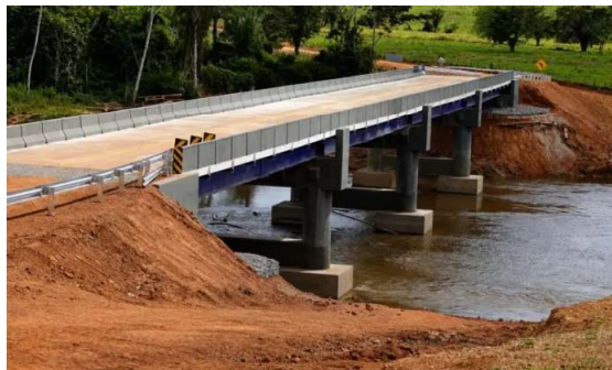
Mesmo com a ponte em funcionamento, o DER-RO continua executando levantamentos topográficos, ensaios laboratoriais complementares e demais procedimentos previstos para a etapa de recebimento da obra.

Os componentes estruturais em concreto atingiram o período de cura necessário e tiveram a resistência prevista em projeto comprovada por meio de ensaios tecnológi-