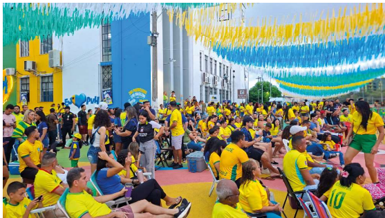
Evento promovido pela Prefeitura transformou o centro da capital em ponto de encontro para quem vive a emoção da Copa do Mundo.

A programação da Rua do Hexa já se consolidou como um dos principais pontos de encontro dos porto-velhenses durante a Copa do Mundo. Promovido pela Prefeitura de Porto Velho, o evento reúne esporte, cultura, lazer e entretenimento em um ambiente preparado para receber pessoas de todas as idades.