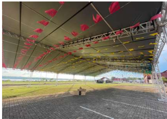
Montagem do espaço segue em ritmo acelerado para receber o público a partir do dia 25 de junho.

É hoje o início do Arraiá do Bera 2026, o Complexo da Estrada de Ferro Madeira-Mamoré já vive o clima da maior festa junina promovida pelo município. Equipes trabalham na montagem da estrutura que irá receber milhares de visitantes entre os dias 25 e 28 de junho, em um evento que celebra a cultura popular, a gastronomia regional e