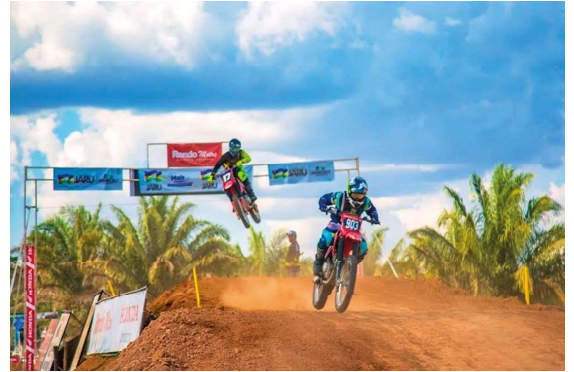
Competição reunirá atletas de cinco estados, distribuirá mais de R$ 50 mil em premiações e terá entrada gratuita nos dias 27 e 28 de junho.