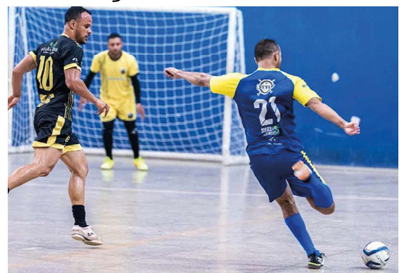
Competição reúne atletas de diversas categorias e distribuirá quase R$ 30 mil em premiações no Ginásio Sebastião Mesquita.

Além de incentivar a prática esportiva, a competição também