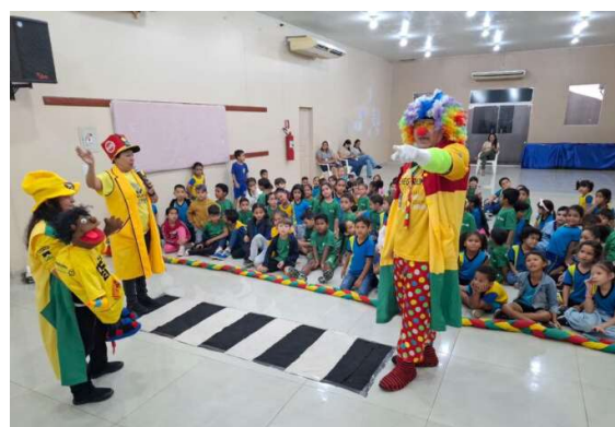
Campanha “Sua Vida Vale Mais” transforma aprendizado em diversão e reforça atitudes que ajudam a salvar vidas desde a infância.

Ao final da atividade, os estudantes participaram de um juramento simbólico, assumindo o compromisso de sempre olhar para os dois lados antes de atravessar a rua. O gesto representou a importância da aten-