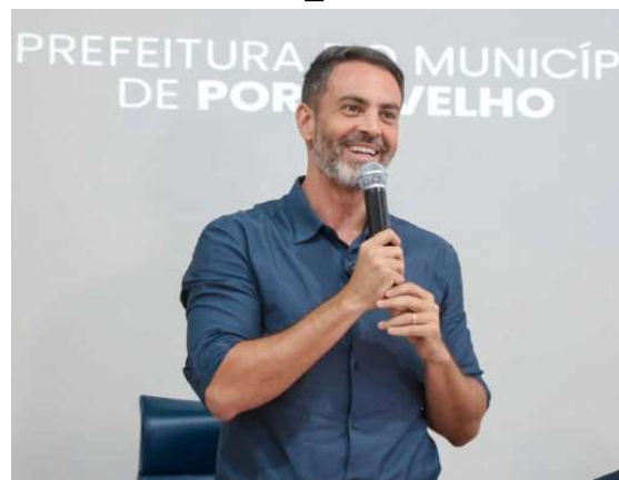
O prefeito Léo Moraes destacou a importância da ampliação dos serviços e da descentralização do atendimento a população.

A expectativa da administração municipal é reduzir a demanda nas demais unidades de atendimento e oferecer mais comodidade aos usuários. A