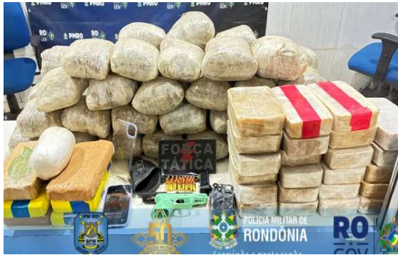
A ação demonstra a eficiência e o comprometimento da Polícia Militar de Rondônia.

A ação demonstra a eficiência e o comprometimento da Polícia Militar de Rondônia no enfrentamento ao tráfico de drogas e à criminalidade organizada. Os suspeitos receberam voz de prisão e foram conduzidos à Delegacia de Polícia Civil juntamente