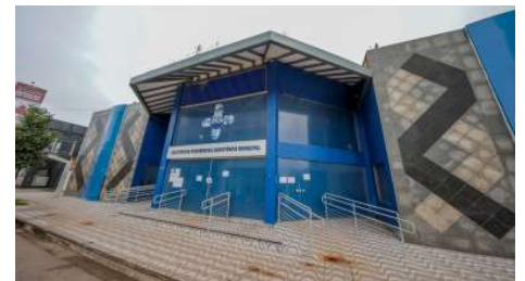
Constatações permitiram identificar fragilidades nos sistemas de controle.

paração ao que encontramos no início da gestão. Hoje os beneficiários contam com um instituto moderno, que mantém suas contas em dia e tem no bom atendimento a sua principal missão. Grande parte dessa transformação foi possível graças às informações levantadas durante a auditoria, que apontaram exatamente o que precisava ser corrigido e aperfeiçoado".