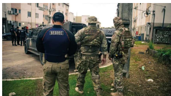
Entre janeiro e junho de 2026, foram realizadas 261 operações integradas, resultado de uma estratégia baseada na atuação conjunta das forças de segurança.

Outras ações importantes incluem a Operação “Sonus Off”, que intensifica a fiscalização contra a perturbação do sossego público, e a Operação “Fio Desencapado”, voltada ao combate ao furto de fios elétricos, cabos de telecomunicações e registros de água.