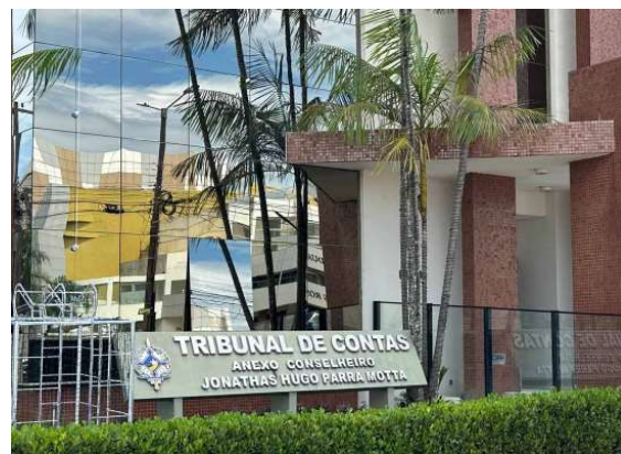
Tribunal apura possível consumo acelerado de recursos e inconsistências em contrato destinado ao atendimento de pacientes do SUS em Rondônia.

A decisão foi tomada após representação apresentada ao Tribunal apontando possíveis inconsistências na execução contratual. Entre os questionamentos estão a realização de procedimentos em volume considerado elevado para o período analisado e a necessidade de verificar a regularidade dos paga-