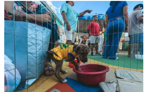
Evento promovido pela Prefeitura de Porto Velho mobilizou famílias e encontrou novos lares para 33 cães e 18 gatos em tempo recorde.

A Prefeitura destacou ainda a importância da parceria entre o poder público, clínicas veterinárias, protetores independentes e a sociedade civil para