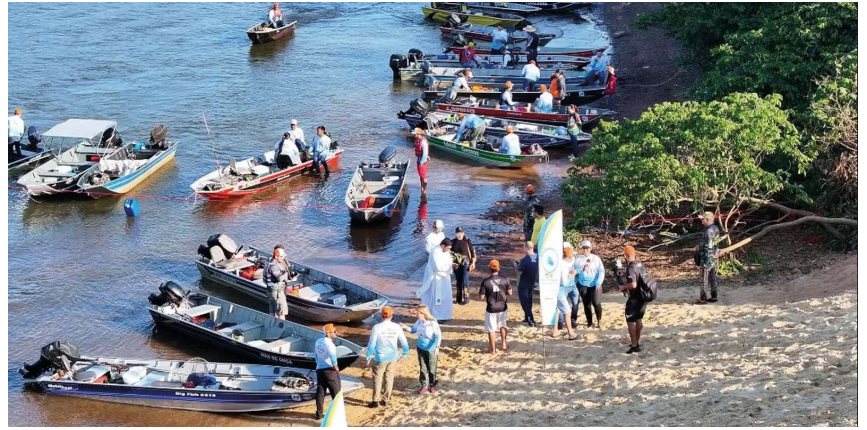
Evento realizado na Praia Municipal movimentou o turismo, fortaleceu a pesca esportiva e atraiu competidores de várias regiões de Rondônia.

Além da movimentação esportiva, o evento gerou impacto positivo na economia local. Hotéis, restaurantes, postos de combustíveis e estabelecimentos comerciais registraram aumento no fluxo de clientes devido à presença de