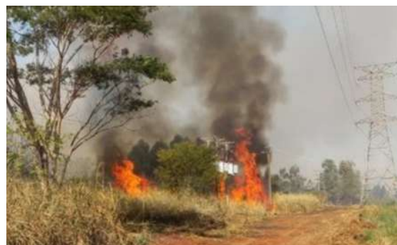
Somente no primeiro semestre deste ano, queimadas próximas à rede elétrica provocaram 17 interrupções no fornecimento de energia e afetaram cerca de 6 mil consumidores em Rondônia.

Para reduzir os riscos, a concessionária orienta a população a não utilizar fogo para limpeza de terrenos, evitar queimadas para formação de pastagens,