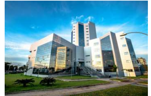
Legislação permite que candidatos aprovados em concursos e processos seletivos negociem débitos tributários e assumam cargos públicos mediante acordo de regularização fiscal.

Com a promulgação da lei, Rondônia passa a contar com um instrumento que