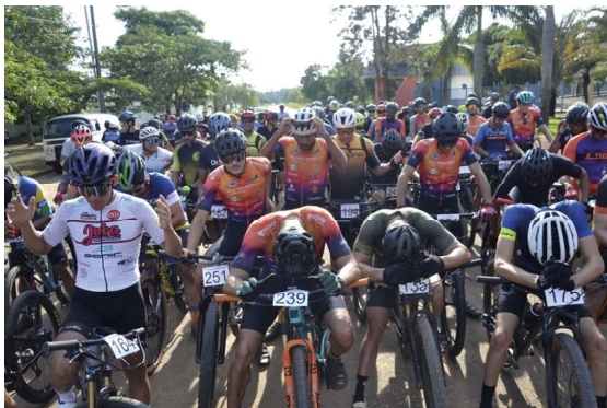
Competição de mountain bike será realizada no dia 28 de junho e integra a programação dos Jogos Abertos de Vilhena 2026.

A Prefeitura de Vilhena, por meio da Secretaria Municipal de Esportes (Semes), abriu as inscrições para a primeira etapa do Circuito Vilhenense de Mountain Bike (MTB) Isaias Martins, que será realizada no dia 28 de junho, com largada e chegada no