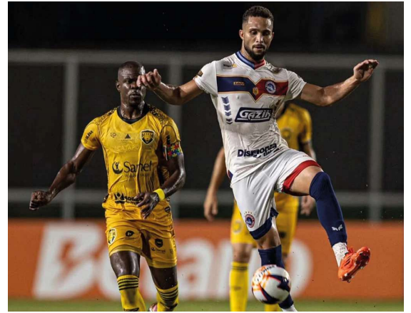
Com a segunda melhor campanha do Grupo 2, Locomotiva enfrentará o São Raimundo-RR e terá a vantagem de decidir a vaga diante da torcida em Porto Velho.

O primeiro duelo contra o São Raimundo será realizado em Roraima. Já a partida decisiva acontecerá em Porto Velho, onde a Locomotiva conta com o apoio da torcida e com um retrospecto positivo atuando em seus domínios. A expectativa é de que a