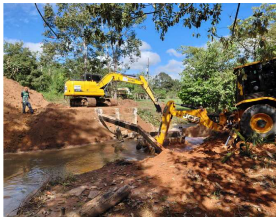
Investimentos em infraestrutura rural garantem mobilidade e segurança para a comunidade. A Prefeitura Municipal.

A Prefeitura de Cacoal, por meio da Secretaria Municipal de Agricultura, realizou na manhã desta terça-feira (16) a revitalização da ponte sobre o Rio Bola de Ouro, no Setor Prosperidade.