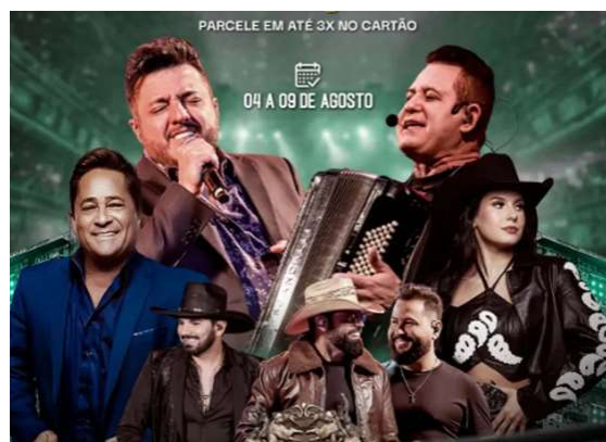
A contagem regressiva para a 37ª edição da Expoagro já começou, e quem ainda não garantiu o passaporte para o evento precisa ficar atento.

Além dos shows, a feira contará com rodeio profissional, exposições de animais, vitrines tecnológicas, palestras, oportunidades de negócios, praça de alimentação e diversas atrações voltadas às famílias e aos produtores rurais. A expectativa é de que a Expoagro gere significativa movimentação