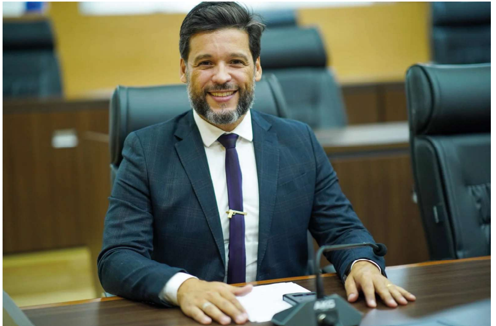
Levantamento nacional aponta deputado de Rondônia como líder em produção legislativa entre parlamentares estaduais do país.