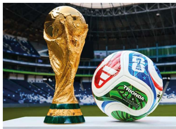
Fan Fest será realizada na FIMCA até 6 de julho, com entrada solidária, telões para os jogos da Copa do Mundo e programação esportiva.

organização é receber milhares de visitantes ao longo do evento, fortalecendo o acesso ao esporte, ao lazer e incentivando a participação da comunidade em ações de solidariedade.