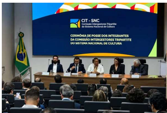
Estado passa a integrar Comissão Intergestores Tripartite e amplia representatividade da Região Norte nos debates sobre cultura.

A Comissão Intergestores Tripartite é responsável pela articulação entre União, estados e municípios para a formulação, pactuação e implementação de políticas públicas voltadas ao fortalecimento da cul-