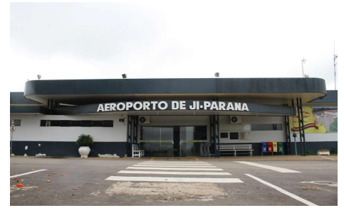
Aeroporto de Ji-Paraná terá um novo terminal de passageiros com capacidade para atender até 240 passageiros por hora-pico.

De acordo com o titular da Coordenadoria de Infraestrutura Aeroportuária