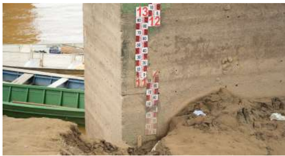
Monitoramento climático aponta possibilidade de seca mais prolongada e exige atenção da população.

provocado pelo aquecimento anormal das águas superficiais do Oceano Pacífico Equatorial, alterando a circulação atmosférica e influenciando o clima em diversas partes do mundo. Na Amazônia, os efeitos costumam ser associados a períodos mais prolongados de seca.