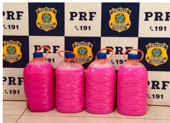
O ilícito tinha como destino a cidade de Cuiabá/MT.