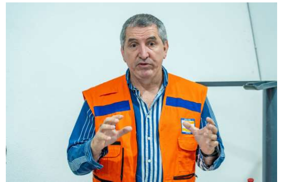
Prefeitura intensifica ações preventivas diante da previsão de calor intenso, baixa umidade e redução das chuvas.

monitoramento constante das condições climáticas permite a adoção de estratégias preventivas para reduzir os impactos da estiagem. Entre as preocupações estão a navegabilidade do rio Madeira, a qualidade do ar e os riscos à saúde provocados pela fumaça decorrente das queimadas.