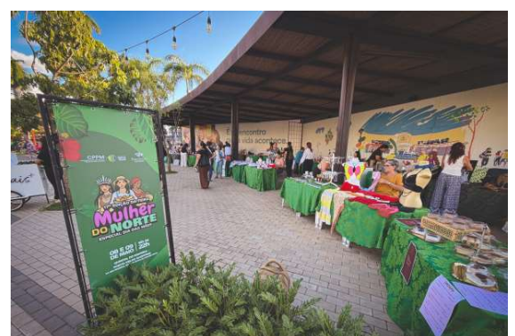
Evento valoriza o empreendedorismo feminino e oferece opções de presentes, gastronomia e artesanato regional.