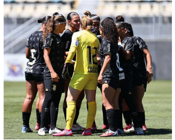
Equipe rondoniense sofreu goleada na abertura da competição nacional e busca recuperação na próxima rodada.

Apesar da derrota na estreia, a comissão técnica do Gazin Porto Velho destacou a im-