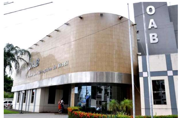
Medida foi adotada após repercussão de decisão judicial que apontou a inserção de comandos ocultos em petição processual.

Segundo a Ordem, o episódio também servirá de base para