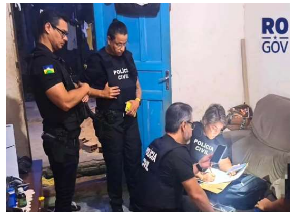
Com base nos elementos apresentados pela DEPCA, a Justiça determinou a busca e apreensão de celulares e computadores dos suspeitos.

Na manhã desta segunda-feira (1º de junho), a Polícia Civil de Rondônia, por meio da Delegacia Especializada em Proteção à Criança e ao Adolescente (DEPCA), cumpriu mandados de busca e apreensão contra investigados por crime sexual praticado contra uma adolescente na capital.