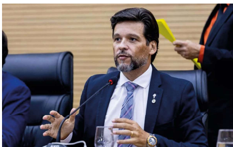
Lei institui data anual para conscientização sobre carga tributária e incentivo ao debate fiscal.

A proposta transforma em política pública uma campanha já realizada em diversas cidades do país, na qual