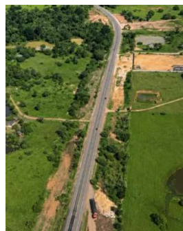
Nova 364 prioriza trechos de maior criticidade.

A Nova 364 dá continuidade aos serviços de manutenção na estrutura da BR-364. Nesta semana, frentes de trabalho iniciam o reparo profundo em dois trechos identificados com maior criticidade na estrutura do pavimento.