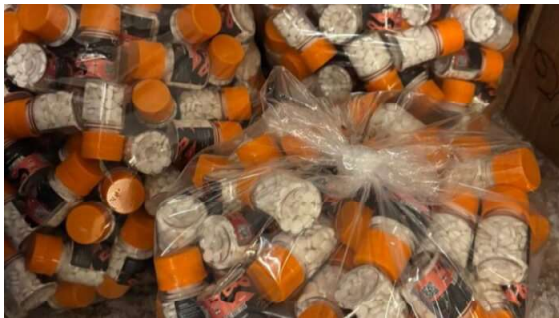
Foram apreendidas 718 ampolas de um princípio ativo usado para controle de peso.

A Polícia Militar de São Paulo descobriu, na madrugada desta segunda-feira (01), um laboratório clandestino usado para manipular canetas emagrecedoras. O imóvel fica localizado na Vila Prudente, na Zona Leste de São Paulo. No local, um homem de 25 anos foi preso em flagrante, ele foi apontado como responsável pela segurança do local.