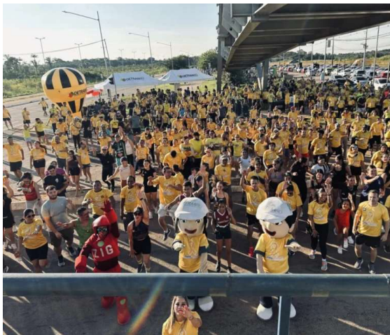
Evento encerrou as ações do Maio Amarelo e reuniu corredores em defesa de um trânsito mais seguro.

O Espaço Alternativo de Porto Velho foi tomado pela cor amarela na tarde de domingo (31), durante a realização da 1ª Corrida "Detran em Movimento". Promovido