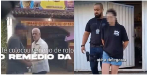
Segundo as investigações, o suspeito colocou veneno de rato em um cachorro-quente e, depois, envenenou remédios da vítima.

A Polícia Civil do Rio de Janeiro prendeu nesta segunda-feira (1) um homem suspeito de colocar veneno de rato em remédio de