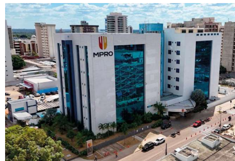
Processo envolve aquisição de 107 toneladas de frango para a merenda escolar e condenação por improbidade administrativa.

Na fase atual de cumprimento da sentença, a Justiça tem realizado diversas medidas para localizar bens e valores dos condenados. Diante das dificuldades encontradas na recuperação do crédito, o juízo autorizou recentemente a retenção de 30% dos salários e proventos de aposentadoria dos executados, além da continuidade das bus-