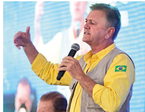
Rondônia Rural Show reforça agronegócio e impulsiona desenvolvimento econômico do estado.

A Rondônia Rural Show segue até o final da semana com programação voltada à inovação, sustentabilidade e ge-