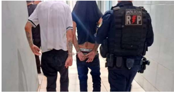
Ação da Polícia Militar no residencial Orgulho do Madeira salvou um jovem de 24 anos que era mantido em cárcere por facção criminosa.

os militares salvaram a vítima e efetuaram a prisão de diversos envolvidos, além da apreensão de uma adolescente. No local, foram encontrados os seguintes itens: Um revólver calibre 38 com munições. Diversas facas, facões e martelos, que seriam utilizados na execução da vítima.