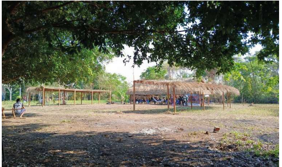
Argumentos como dificuldade de acesso às comunidades São Luiz e Sotério levaram a Justiça Eleitoral a mudar decisão sobre a criação das seções eleitorais.

Na nova decisão, o TRE afirmou que a criação das seções eleitorais representa elevado alcance democrático em regiões historicamente marcadas por barreiras geográficas e exclusão de serviços públicos essenciais.