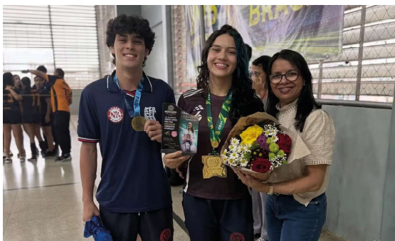
Campeões foram homenageados pela escola após conquistas estaduais e nacionais.

Entre uma aula e outra, a bola rola na quadra, os corredores ficam cheios e o sinal continua tocando normalmente. Mas nos últimos dias, a rotina da Escola Murilo Braga, em Porto Velho, ganhou um motivo diferente para comemorar. Alguns alunos trocaram o uniforme