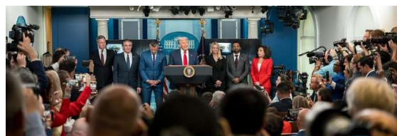
Presidente Donald Trump.

Neste novo mandato, o governo de Donald Trump vem reorientando a política externa de Washington em relação à América Latina, direcionando sua máquina de guerra para a região