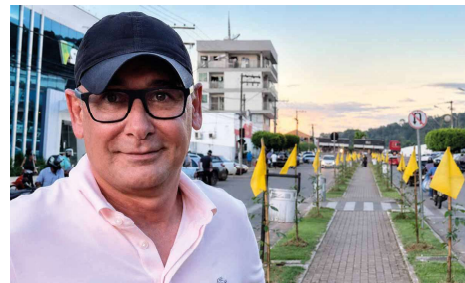
Decisão reconhece competência do Tribunal para continuidade das investigações envolvendo prefeito municipal.

Com a decisão, todos os autos serão encaminhados ao Tribunal de Justiça de Rondônia, que passará a analisar os próximos atos da investigação. O processo permanece na fase de inquérito policial e não há, até o momento, julgamento sobre a existência ou não dos crimes in-