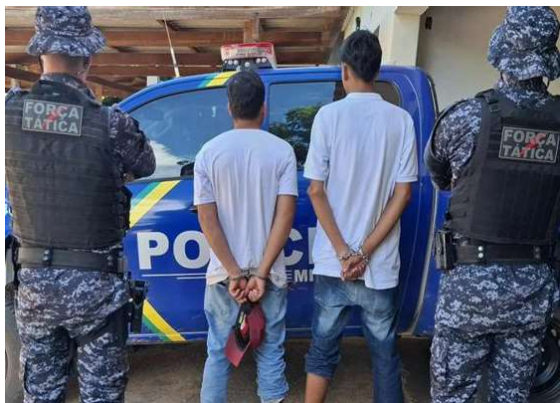
Durante a averiguação, os policiais constataram que no interior da mala havia aproximadamente 15,7 quilos de substância análoga à maconha.

A Polícia Militar de Rondônia, por meio do Batalhão de Polícia de Fronteira e Divisas (BPFRON) e equipes da Força Tática do 1º BPM, realizou duas importantes ações de combate ao tráfico de drogas nesta quinta-feira (28), pela manhã, no município de Guajará-Mirim, região de fronteira entre Brasil e Bolívia, durante a execução da Operação Brasil Contra o Crime Organizado.