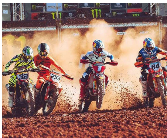
3ª etapa do Estadual Rondoniense promete reunir pilotos de várias regiões e impulsionar economia local com apoio ao esporte.

Com a etapa confirmada na cidade, a expectativa é de movimentação em diversos setores da economia local. Comércio, hotelaria, alimentação e turismo estão entre