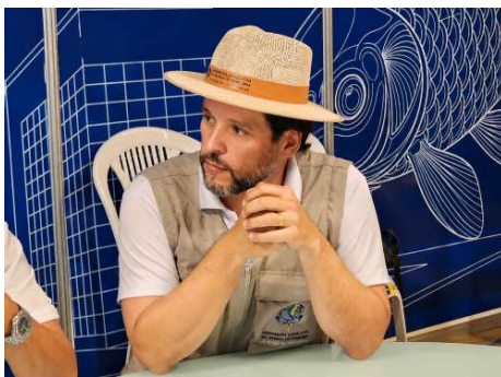
Parlamentar alerta para riscos de avanço do narcotráfico e cobra planejamento nas áreas de fronteira.

Segundo o parlamentar, Rondônia possui uma extensa faixa de fronteira com a Bolívia e já enfrenta desafios rela-