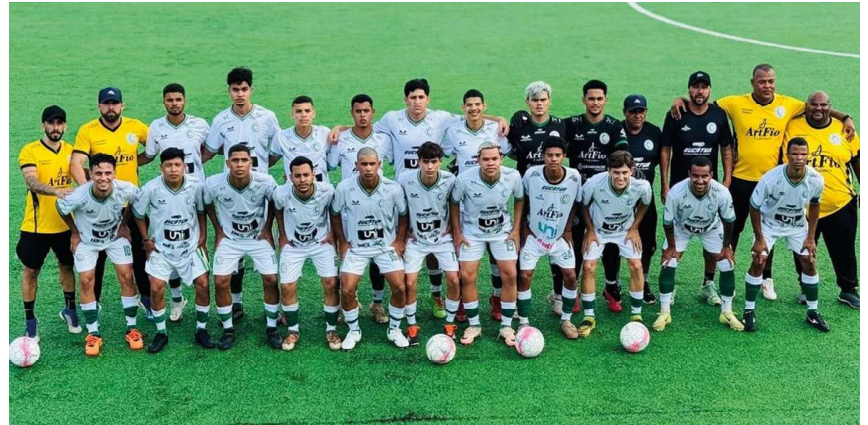
Equipe integra a Chave B da competição estadual ao lado de clubes tradicionais do futebol rondoniense.

A expectativa da diretoria e da torcida é