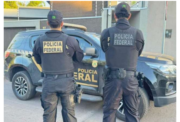
Operação Alvo Cerrado cumpre quatro mandados de busca e apreensão em Guajará-Mirim/RO e em Pontal do Araguaia/MT.

Os investigados poderão responder pelo crime de lavagem de capitais, sem prejuízo da apuração de outros delitos eventualmente identificados no decor-