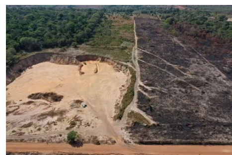
Segundo o MPF, o grupo retirou 137 mil metros cúbicos de minérios sem autorização em uma área federal de Vilhena (RO).

Na ação, o MPF pede que a Justiça condene os réus ao pagamento de R$ 5,4 milhões pelos prejuízos causados à União. O órgão também pede indeniza-