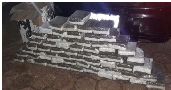
De acordo com as primeiras informações, os policiais realizavam uma abordagem de rotina.

atenção especial das forças de segurança devido às rotas utilizadas por organizações criminosas para o transporte de entorpecentes e outros produtos ilícitos.