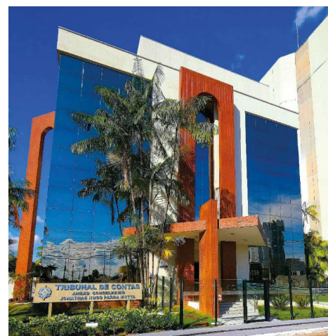
Tribunal aponta indícios de irregularidades no processo e cita servidores municipais para apresentação de defesa.

Conforme a decisão, caso não sejam apresentados elementos capazes de sanar as inconsistências apontadas, os envolvidos poderão responder administrativamente no âmbito do processo de controle externo. O Tribunal também alertou para possibilidade de revelia em