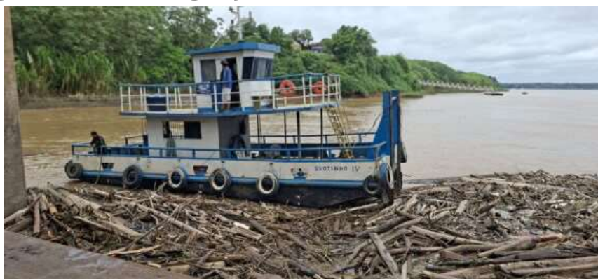
Equipe maneja troncos e restos de madeira retidos na estrutura dos cais do Porto de Porto Velho.

Já a segunda frente concentra o desvio controlado de troncos, galhadas e resíduos vegetais acumulados