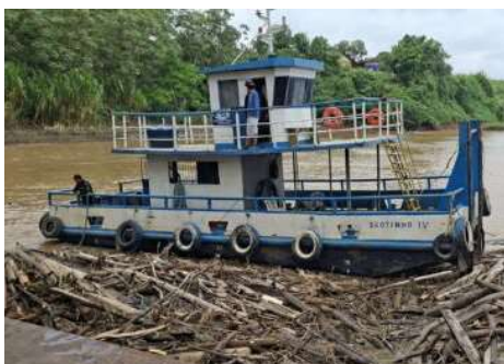
Equipe maneja troncos e restos de madeira retidos na estrutura do cais do Porto de Porto Velho. PÁGINA 05

Soph intensifica manutenção no Porto de Porto Velho para garantir segurança da navegação