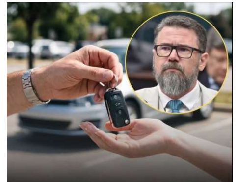
PEC apresentada na Câmara propõe retirar da Constituição a autorização para cobrança dos tributos.

Nas redes sociais, a proposta gerou repercussão imediata, dividindo opiniões entre apoiadores, que defendem menor carga tributária sobre o patrimônio,