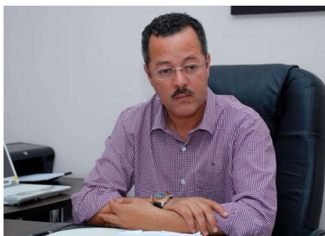
Segundo o relator do processo, não há prova de participação do ex-prefeito no suposto desvio de recursos. PÁGINA 04