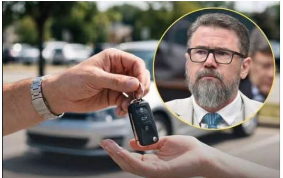
PEC apresentada na Câmara propõe retirar da Constituição a autorização para cobrança dos tributos. PÁG. 03

O texto também prevê uma compensação temporária da União por até cinco anos, com o objetivo de reduzir o impacto financeiro causado pela perda de arrecadação para estados e prefeituras.