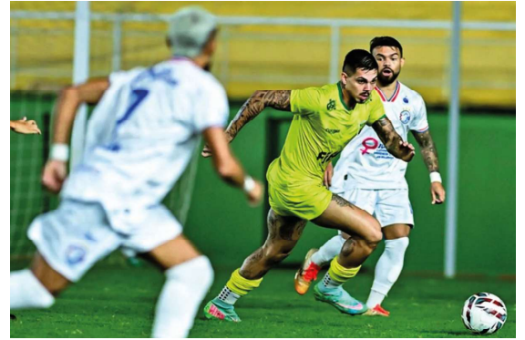
Guaporé aposta na força da torcida para duelo decisivo no Cassolão pela Série D.

Além da importância esportiva, a partida também representa uma oportunidade de fortalecimento do futebol rondoniense, com a presença da torcida sendo fator decisivo para impulsionar a equipe em busca de mais um resultado.