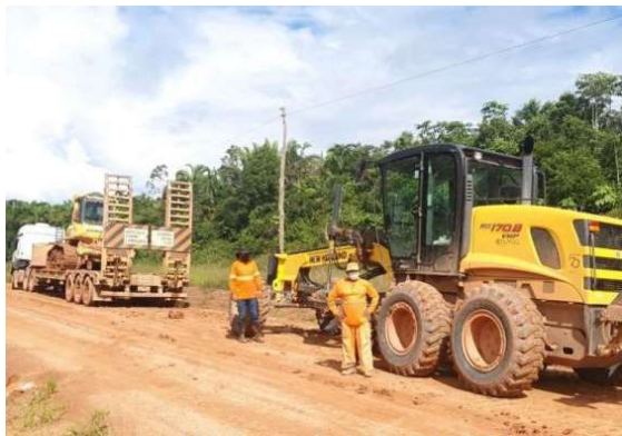
Trecho entre os quilômetros 469 e 590 da rodovia federal receberá serviços de melhoria no Amazonas.

O Departamento Nacional de Infraestrutura de Transportes (DNIT) divulgou o resultado do Pregão Eletrônico nº 90127/2026, destinado às obras de melhoria da BR-319, no trecho entre os quilômetros 469,6 e 590,1, no estado do Amazonas. A vencedora da licitação foi a construtora ETAM Ltda, após apresentar proposta com descon-