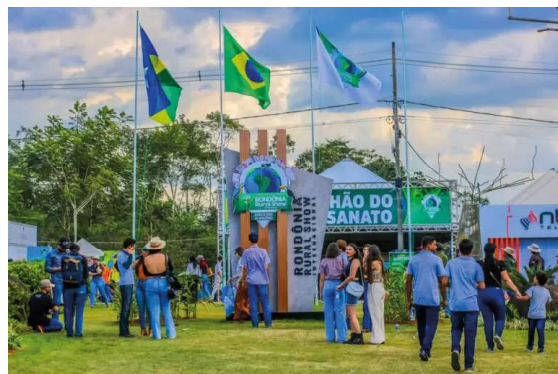
A Vitrine Tecnológica da Emater-RO está entre os espaços mais visitados da feira.

“A Emater-RO tem um papel fundamental no desenvolvimento rural do estado, levando assistência técnica, inovação e conhecimento aos produtores rurais, e a Rondônia Rural Show é uma oportunidade de aproximar ainda mais o agricultor dessas novas tecnologias e mostrar resultados