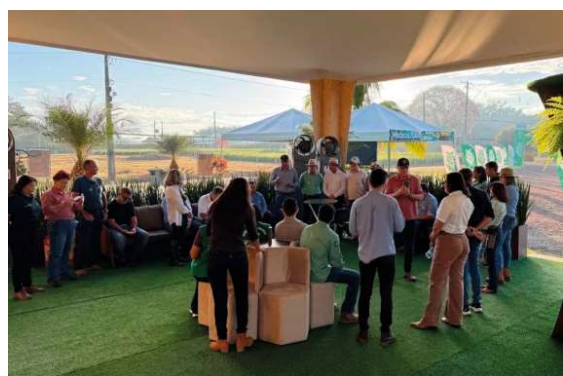
Durante toda a programação da RRSI, o público poderá acompanhar as atividades promovidas pela Emater-RO.

Além da mobilização visual com servidores vestidos de amarelo, o evento contou com o “Túnel do Trânsito”, ferramenta educativa que neste ano tem como foco os motociclistas, grupo que concentra altos índices de acidentes graves e mortes no trânsito. A ação reforça a importância da conscientização, da responsabilidade coletiva e da adoção de comportamentos mais seguros nas vias urbanas e rodovias do estado.