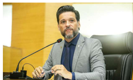
Parlamentar questiona o Governo sobre déficit no quadro docente, reposição de aulas e convocação de aprovados para atuação na unidade escolar.

pública estadual com modelo de gestão cívico-militar e atende estudantes da região de Rolim de Moura. A preocupação com a regularidade do quadro de profissionais ocorre em meio à necessidade de garantir continuidade das atividades pedagógicas, cumprimento da carga horária obrigatória e manutenção da qualidade do ensino ofertado à comunidade escolar.