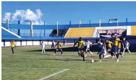
Locomotiva soma ponto importante diante do Araguaína e mantém chances de classificação no Grupo A2.

A Série D reúne clubes de todas as regiões do país em uma das disputas mais equilibradas do calendário nacional, onde apenas os melhores