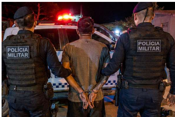
A mulher recebeu atendimento emergencial e foi encaminhada ao Hospital de Pronto-Socorro pelo Corpo de Bombeiros.

Casos de violência doméstica seguem sendo uma das ocorrências mais recorrentes atendidas pelas forças de segurança em todo o país, exigindo resposta rápida para proteção das vítimas e responsabilização dos agressores. A legislação brasileira prevê mecanismos específi-