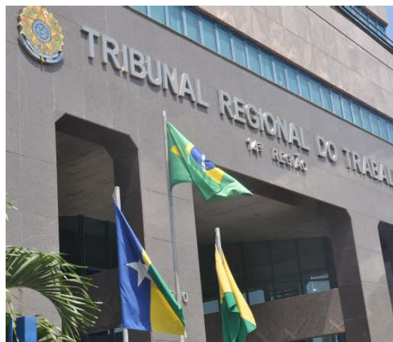
Material atualizado amplia informações sobre prevenção, acolhimento, canais de denúncia e garantias de proteção às vítimas, testemunhas e denunciante.

O material cita como exemplos de práticas vedadas transferências arbitrárias, isolamento profissional, perseguições disciplinares sem fundamento, prejuízos funcionais e exonerações injustificadas. As garantias de proteção também se estendem a trabalhadores terceirizados, ampliando a