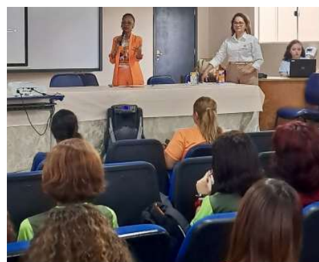
Campanha da Prefeitura intensifica ações de conscientização nas escolas e alerta para aumento de notificações de violência sexual na capital.

Como parte da programação do Maior Laranja, a Semusa participou de uma ação educativa em parceria com a Secretaria de Estado da Educação na Escola Flora Calheiros, na zona Leste da capital. Durante as atividades, estudantes e equipes pedagógicas participaram de palestras sobre identificação de sinais de abuso, fortalecimento da rede de proteção, canais de denúncia e os riscos da violência no ambiente digital.