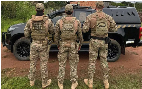
Operação Vento Norte cumpre três mandados de busca e apreensão em Pontes e Lacerda/MT e em Guajará-Mirim/RO.

A Polícia Federal deflagrou, nesta quarta-feira (20), a Operação Vento Norte, com o objetivo de combater o tráfico interestadual de drogas e desarticular uma organização criminosa com atuação entre os estados de Mato Grosso e Rondônia. A ação ocorreu simultaneamente nos municípios de Pontes e Lacerda (MT) e Guajará-Mirim (RO), com