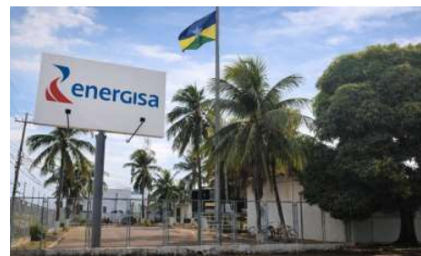
Medida deve beneficiar distribuidoras da Amazônia Legal e aliviar reajustes tarifários em 2026.

Além do impacto direto para os consumidores residenciais, a medida também poderá beneficiar pequenos empresários, comerciantes e produtores rurais, segmentos que frequentemente apontam o custo da energia como um