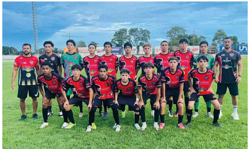
Pimentense, Ji-Paraná e Espigão disputam os títulos do Rondoniense Sub-15 e Sub-17 em decisões que movimentam o futebol estadual.

do Estado de Rondônia (FFER) é de bom público nas decisões, encerrando mais uma edição do campeonato com alto nível técnico e reforçando a importância do investimento contínuo nas categorias de base para o