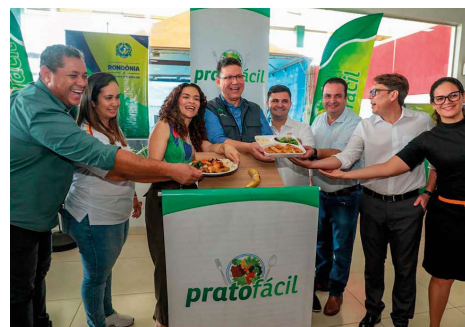
Cerca de 30 mil refeições são servidas por mês a famílias em situação vulnerável no estado, ao custo de R$ 2.

Prato Fácil completa 5 anos servindo alimentação à população em Rondônia