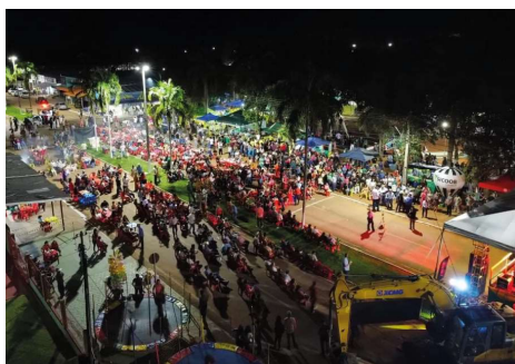
Evento chegou à 17ª edição valorizando a agricultura familiar, a cultura regional e os produtores locais.

Festa do Milho reúne famílias e movimentação economia durante tradição em Cabixi