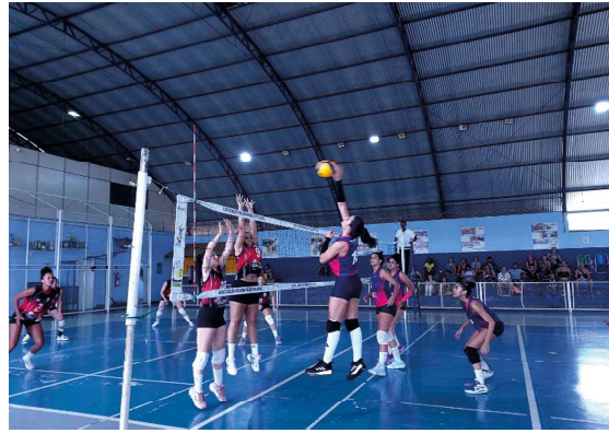
Com 15 modalidades já garantidas na fase final, município busca vagas remanescentes no Futebol Society, Handebol, Futsal e Vôlei durante o mês de maio.

Para as modalidades restantes, o caminho rumo à fase final passa pela Fase Regio-