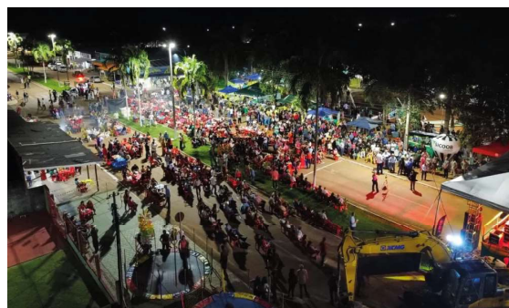
Evento chegou à 17ª edição valorizando a agricultura familiar, a cultura regional e os produtores locais.

A administração municipal destacou que a manutenção da Festa do Milho representa o compromisso em preservar a identidade cultural de Cabixi e incentivar ativi-