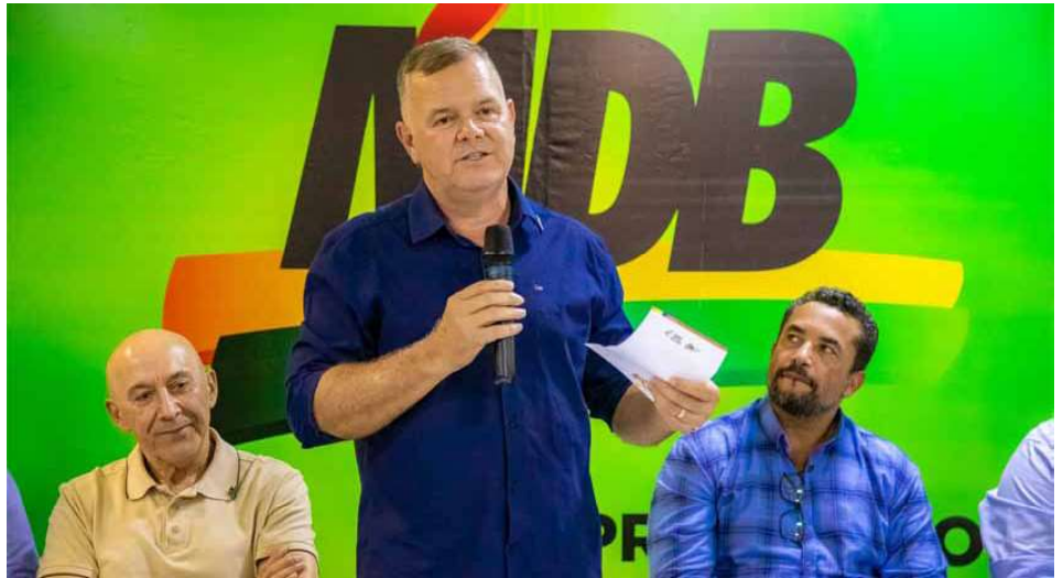
Partido terá suspensão do fundo partidário após decisão unânime da Corte Eleitoral.

Conforme destacado no julgamento, o material gráfico teria sido produzido apenas um dia antes do pleito eleitoral, levantando questionamentos sobre a efetiva utilização e regularidade da despesa declarada pelo partido.