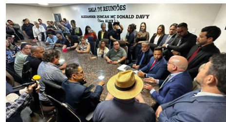
Suposta agressão dentro de gabinete gera crise política na Câmara Municipal.

O episódio provocou reação de entidades ligadas à comunicação e à defesa da atividade jornalística. Participaram da reunião representantes do Sindicato dos Jornalistas de Rondônia (Sinjor), da Federação Nacional dos Comunicadores (Fenacom), da Rede Nacional de Proteção a Jornalistas e Comunicadores e integrantes do grupo União dos Jornalistas.