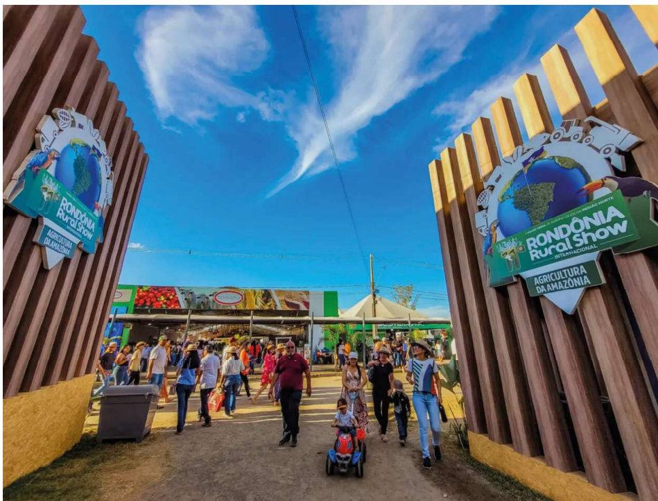
A região central de Rondônia é transformada pela evolução da Rondônia Rural Show Internacional (RRSI).

O evento não só integra as regiões do estado como contribui para novo patamar de desenvolvimento da região central, com a conquista da agropecuária tecnificada e do segundo melhor desempenho na abertura de novos negócios e geração de empregos em todo o estado, ficando atrás apenas da região Madeira-Mamoré.