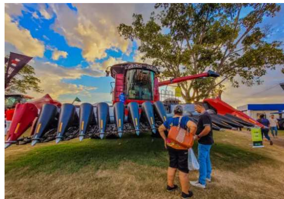
O acesso à tecnologia reflete em uma melhor produtividade.

O resultado é prosperidade no campo, que tem ajudado Rondônia a vencer outro