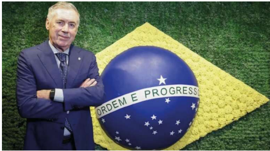
Treinador da Seleção Brasileira anuncia os 26 atletas que irão disputar o Mundial de 2026 nesta segunda-feira (18), no Museu do Amanhã, no RJ.

A expectativa toma conta do futebol brasileiro nesta segunda-feira (18), quando o técnico Carlo Ancelotti anunciará a lista oficial com os 26 jogadores convocados para defender a Seleção Brasileira na Copa do Mundo de 2026. O evento será realizado no Museu do Amanhã, no Rio de Janeiro, com início previsto para as 17h, enquanto a divulgação dos nomes deve ocorrer às 17h45, se-