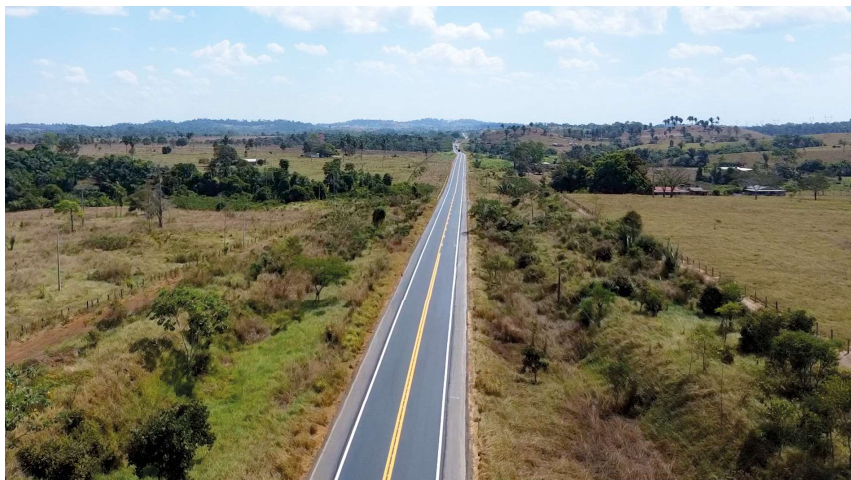
Trecho próximo ao entroncamento com a BR-364 registra intenso fluxo de veículos e preocupação com acidentes.

Um pedido encaminhado ao Departamento Estadual de Estradas de Rodagem e Transportes de Rondônia (DER) solicita a instalação de redutores de velocidade e sonorizadores na RO-470, nas proximidades do entroncamento com a BR-364, em Ouro Preto do Oeste.