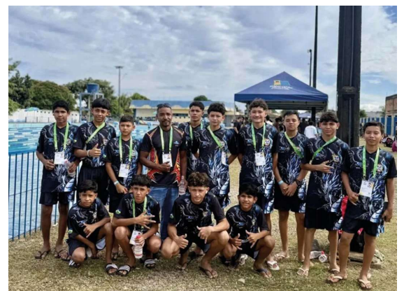
Seletiva estadual dos Jogos Escolares de Rondônia (Joer) nas modalidades individuais reuniu estudantes-atletas de diferentes regiões do estado.

Na natação e nas artes marciais, participantes destacaram a importância do incentivo familiar, da dedicação aos treinos