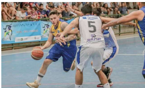
Jovem atacante teria acusado o camisa 10 de agressão e enviado notificação ao clube.

No próximo sábado (9), o Ginásio Eduardo Lima e Silva (Dudu), na zona sul de Porto Velho, será palco das finais da seletiva dos Jogos Intermunicipais de Rondônia (JIR) 2026, promovidas pela Prefeitura de Porto Velho, com entrada aberta ao público.