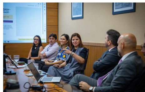
A manifestação do CNJ reforça o compromisso da Corregedoria-Geral da Justiça de Rondônia.

O relatório evidencia que a CGJ vem consolidando um modelo de atuação cor-