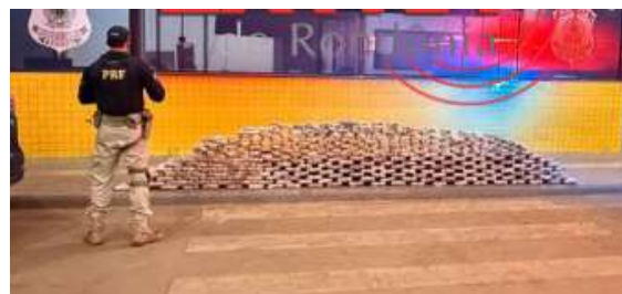
Dupla catarinense foi presa após fuga pela rodovia; mais de 275 quilos de entorpecentes, munições e pistola foram apreendidos pela Polícia Rodoviária Federal.

As investigações apontam que a rota utilizada pelos suspeitos é frequentemente monitorada pelas forças de segurança por