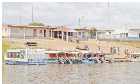
Decisão atende ação do MPF que aponta falhas de controle e rota de contrabando de mercúrio na fronteira com a Bolívia.

A Justiça Federal determinou que a União e a Agência Nacional de Transportes Aquaviários elaborem, no prazo de 90 dias, um plano integrado de fiscalização para o Porto Fluvial de Guajará-Mirim. A decisão atende ação civil pública proposta pelo Ministério Público Federal, que aponta falhas graves na fiscalização da região de fronteira com a Bolívia.