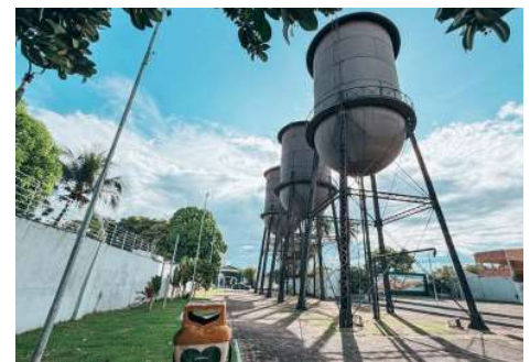
Projeto prevê melhorias na iluminação e reorganização dos espaços de convivência.

Considerada um dos cartões-postais mais tradicionais da capital, a Praça das