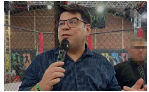
Processo apura supostas irregularidades em adesão a ata de registro de preços para manutenção da frota municipal.

Conforme registros do TCE-RO, o gestor encaminhou os documentos den-