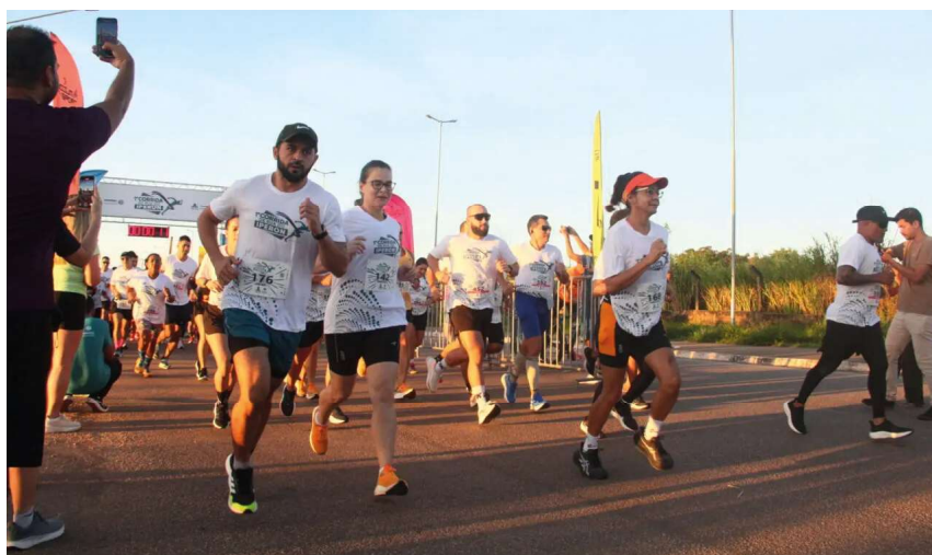
Evento acontece em junho e une esporte, saúde e ações sociais voltadas à comunidade.

sem fins lucrativos. A expectativa da organização é ampliar o número de participantes nesta edição e consolidar o evento no calendário esportivo e social de Rondônia, unindo esporte, cidadania e solidariedade.