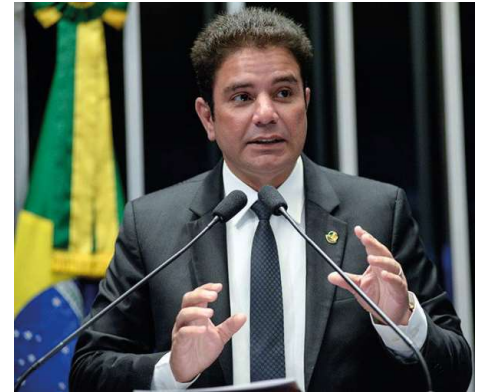
Corte Especial fixou pena de prisão, multa milionária e indenização superior a R$ 11,7 milhões ao Estado.

O colegiado também considerou válidos os relatórios financeiros produzidos pelo Conselho de Controle de Atividades Financeiras (Coaf), entendendo que