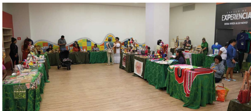
Evento da Prefeitura reúne empreendedoras, incentiva geração de renda.

Para o prefeito Léo Moraes, a feira representa oportunidade, valorização e incentivo ao protagonismo feminino. “É uma ação que fortalece o empreendedorismo e dá visibilidade às mulheres que