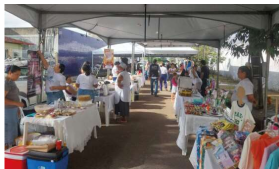
Semana do Trabalhador reuniu ações de inclusão produtiva, acessibilidade e incentivo ao empreendedorismo de mães atípicas.

A ação buscou valorizar mulheres que conciliam o cuidado com filhos com defici-