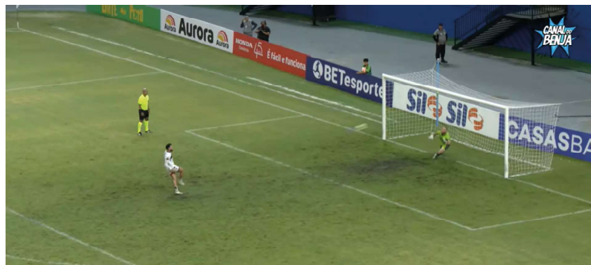
Locomotiva empata no tempo normal com o Nacional-AM, mas perde nas penalidades na Arena da Amazônia.