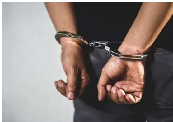
Suspeito foi preso nos Estados Unidos em outubro de 2025, após entrar na lista da Interpol. Ele será transferido de Minas Gerais para Rondônia por decisão da Justiça.

As investigações apontam que os crimes teriam ocorrido entre 2022 e 2023, pe-