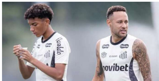
Jovem atacante teria acusado o camisa 10 de agressão e enviado notificação ao clube.