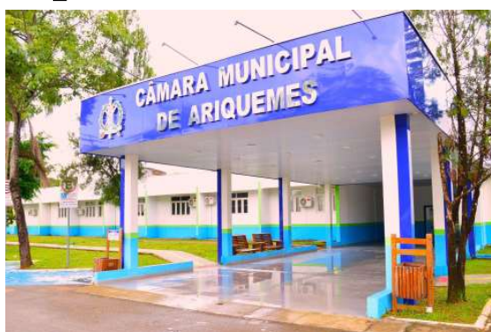
Projeto aprovado pela Câmara busca reduzir entraves tributários e ampliar segurança jurídica na regularização fundiária rural.

O PL aprovado destaca ainda que a alteração contribuirá para facilitar a regularização registral e dominial dos imóveis, reduzir entraves tributários e incentivar a formalização da propriedade rural. Com isso, produtores e possuidores titulados terão mais se-