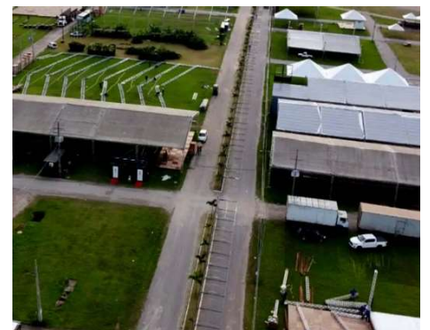
As ruas do parque receberam revestimento com pedra brita, garantindo uma estrutura adequada para suportar o intenso fluxo de visitantes.