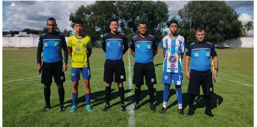
Jogos decisivos acontecem em rodada única no próximo fim de semana.

Na categoria Sub-17, os duelos serão entre Rondoniense x Brazuca, Ji-Paraná x Rolim de Moura, Vi-