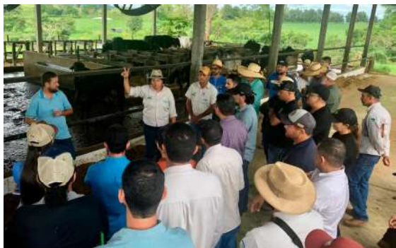
O Consultec-Leite tem se consolidado como uma das principais iniciativas de apoio à pecuária leiteira no estado.

O governo de Rondônia, por meio da Emater-RO, promove entre os dias 13 e 17 de abril o curso “Criação de Bezerras e Novilhas”, voltado à capacitação de extensionistas que atuam diretamente no campo. A formação ocorre no Centro de Treinamento da instituição, em Ouro Preto do Oeste, e integra as ações do projeto Consultec-Leite, financiada com recursos do