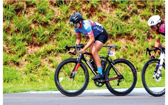
A atleta afirmou que a conquista é resultado da dedicação e da realização de um sonho cultivado com muito esforço e persistência.

“Logo no primeiro ano de Joer, foi campeã nas três provas que disputou, conquistando o título geral. Nos Jogos Escolares Brasileiros, no Rio de Janeiro, também se destacou como vice-campeã brasileira. Ao longo da trajetória, se confirmou como um talento promissor no ciclismo, sempre muito dedicada, comprometida e focada nos treinamentos. Por dois anos consecutivos foi a número um do estado e também foi medalhista da Copa Norte