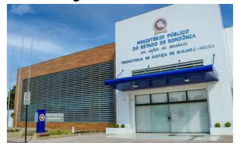
De acordo com o promotor, os novos dados serão reanalisados sobre a viabilidade de recomendação.

Conforme demonstrado no relatório apresentado ao Ministério Público, o total efetivamente pago no exercício