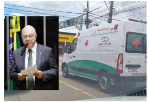
A empresa UNI SOS Emergências Médicas Ltda, assumiu o contrato na noite de 31 de março.

Persistem dúvidas técnicas relevantes na proposta apresentada pela empresa, começando pelo endereço fiscal em Candeias do Jamari, onde a alíquota