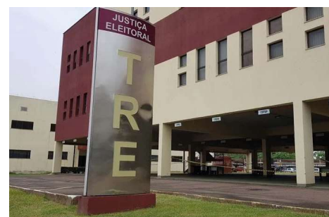
Irregularidades no uso do fundo partidário levaram à aplicação de multa e recolhimento de valores ao Tesouro Nacional.

Com a decisão, o União Brasil deverá devolver os valores de forma parcelada, mediante desconto nos repasses futuros do fundo partidário pelo período de 12 meses, conforme determinado pela Justiça Eleitoral.