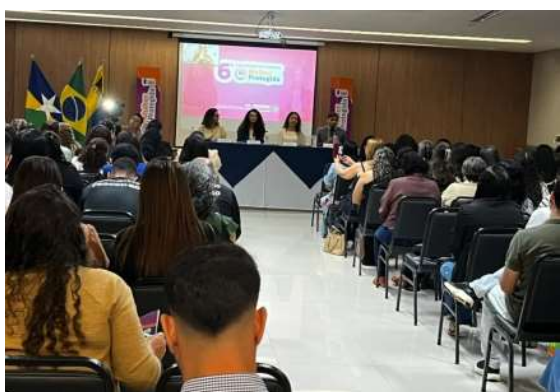
Processo mais flexível permite início por aplicativo e reduz carga mínima de aulas práticas.

O governo de Rondônia iniciou, nesta terça-feira (14), em Porto Velho, a 6ª capacitação do Programa Mulher Protegida, reunindo cerca de 200 profissionais da rede de atendimento à mulher. A ação é coordenada pela Secretaria