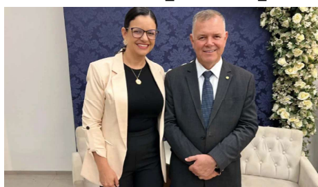
O Implanon é um implante hormonal subdérmico, de longa duração, que pode prevenir a gravidez por até três anos.

O município de Jarú foi contemplado com um importante investimento na área da saúde pública. O deputado federal Lúcio Mosquini destinou R$ 300 mil em recursos para a aquisição do Implanon, um método contraceptivo moderno e altamente eficaz, voltado à prevenção da gravidez.