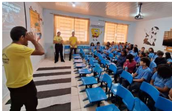
Atividades envolveram estudantes e motoristas com foco em segurança e prevenção de acidentes.

Uma atividade educativa voltada à conscientização no trânsito foi realizada na quarta-feira (15), com ações em uma escola municipal e em um estacionamento de supermercado, envolvendo estudantes e a comunidade.