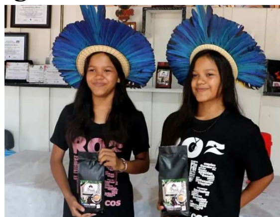
A etnia Aruá é notável pelo uso e práticas culturais específicas, em destaque a produção de café orgânico, que vem sendo premiada desde o ano de 2020.

Destacam-se as ações da assistência técnica em culturas comerciais como a do café e a coleta da Castanha do Brasil ( Bertholletia excelsa ) mas, o trabalho dos exten-