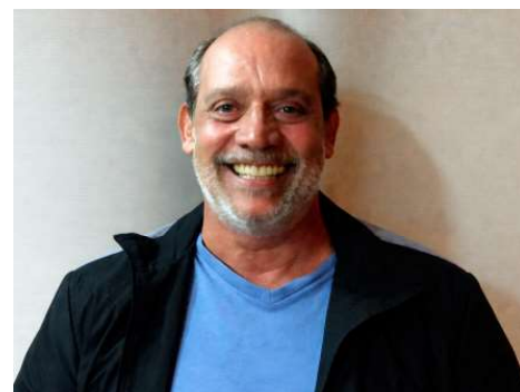
Ex-chefe da Casa Civil e empresário de 68 anos não resistiu após perder o controle da motocicleta em rodovia próxima a Brasília; causas do acidente são investigadas.

Na política, sua atuação começou como suplente no Congresso Nacional entre 1996 e 1999. Posteriormente, foi eleito deputado federal por Rondônia para a legislatura de 1999 a 2003, período em que se destacou em pautas relacionadas à viação, transportes e desenvolvimento. No mesmo ano de 1999,