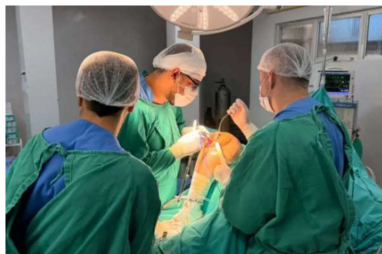
Unidade em Porto Velho passa a realizar procedimentos de alta complexidade e busca reduzir fila de espera.

Hospital e Pronto-Socorro João Paulo II e ao Hospital de Base Dr. Ary Pinheiro, além de receber pacientes encaminhados de outras unidades do estado.