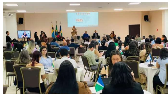
Encontro reuniu gestores e técnicos da Assistência Social, em Porto Velho, para melhoria das ações socioassistenciais em todo o estado.

Entre os anos de 2020 e 2025, o Financiamento Estadual