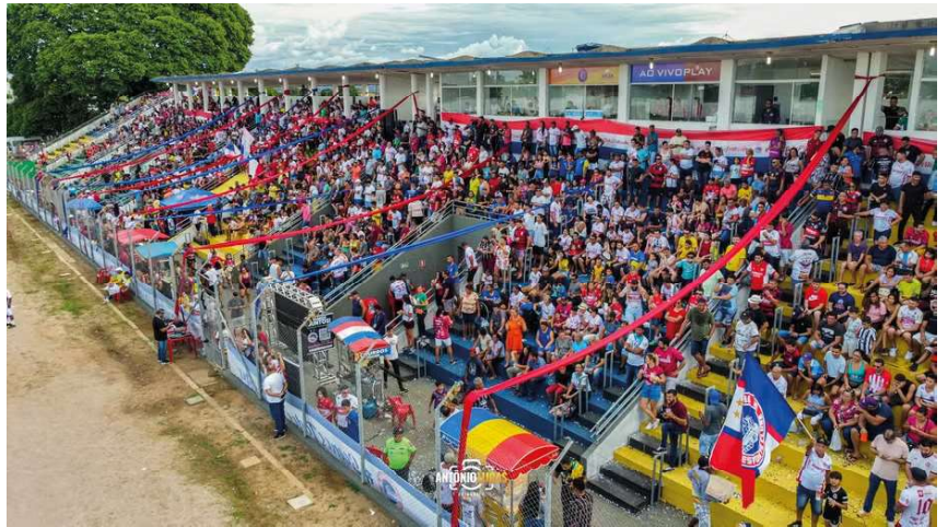
O futebol rondoniense vive um momento de alta histórica em 2026, caracterizado por um campeonato estadual de destaque, títulos inéditos, recordes de participação em competições nacionais e público presente nos estádios pela Capital e Interior.

Outro ponto que nos enche de orgulho é ver o futebol feminino ocupando o espaço que sempre mereceu por direito. Através da Série A3, a Desportiva Itapuense e o Rolim de Moura já iniciaram a jornada com 120 mil reais cada. Ver o futebol praticado por mulheres recebendo parte desse investimento recorde de 685 milhões