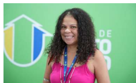
Iniciativa une teoria e prática para orientar mulheres em situações de risco.

A ação conta com o apoio da Polícia Militar de Rondônia. Instrutores do Batalhão de Choque estarão à frente da capacitação, trazendo a experiência de