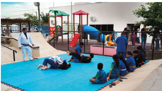
Iniciativa gratuita promove inclusão e desenvolvimento.

O Projeto Construindo Campeões tem levado oportunidades para crianças e adolescentes em Porto Velho por meio do esporte. Desenvolvido pela Prefeitura, com ações coordenadas pela Secretaria Municipal de Turismo, Esporte e Lazer (Semtel), o programa funciona