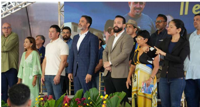
Residenciais Porto Madero II e V beneficiam centenas de moradores e simbolizam avanço na política habitacional.

A entrega de 592 unidades habitacionais nos residenciais Porto Madero II e Porto Madero V, em Porto Velho, marcou um novo capítulo na vida de centenas de famílias da zona Leste da capital. Mais do que números, a ação representa a realização do sonho da