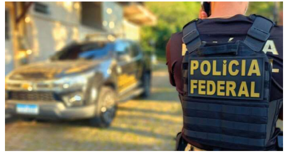
Operação Rastro Zero cumpre mandado de busca e apreensão contra grupo investigado em Porto Velho.

No dia seguinte à verificação dos furtos, foi registrado incêndio no mesmo depósito. Elementos técnicos afastaram causas acidentais e indicam origem intencional. Os elementos reunidos até o momento apontam atuação coordenada, possível facilitação interna, uso indevido de