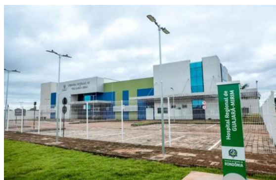
Investigados por desvios na saúde em outros estados, empresários chegaram a ser cotados para contrato milionário em Porto Velho.

O TCE investiga possível configuração de “emergência ficta”, quando há omissão administrativa para justificar contratação sem licitação, além de suspeitas de favorecimento. O órgão fixou novo prazo de 60 dias para regularização,