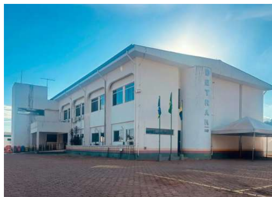
Mudança já está em vigor e busca agilizar o contato com a Procuradoria do órgão.

A modernização dos canais faz parte de um conjunto de medidas adotadas pelo Detran-RO para digitali-