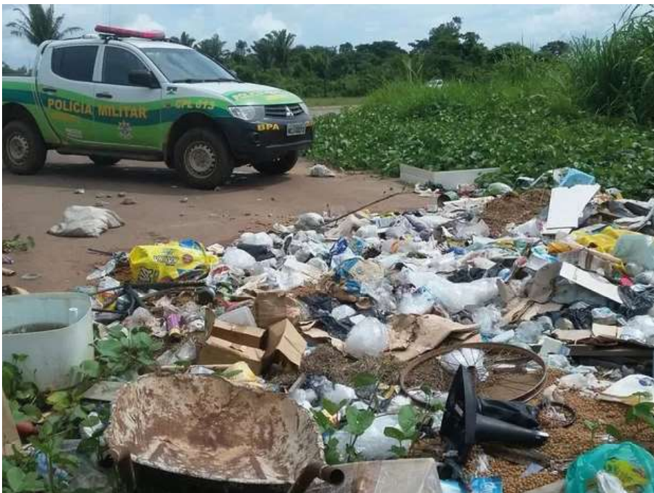
O Judiciário concedeu o prazo de 6 meses ao Município de Guajará-Mirim para comprovação do cumprimento das determinações.