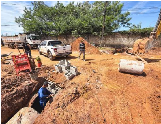
Ações simultâneas buscam reduzir alagamentos e melhorar mobilidade em diferentes regiões da capital.

No bairro Eldorado, na zona Sul, foram executados serviços de desobstrução de bocas de lobo e reparos em