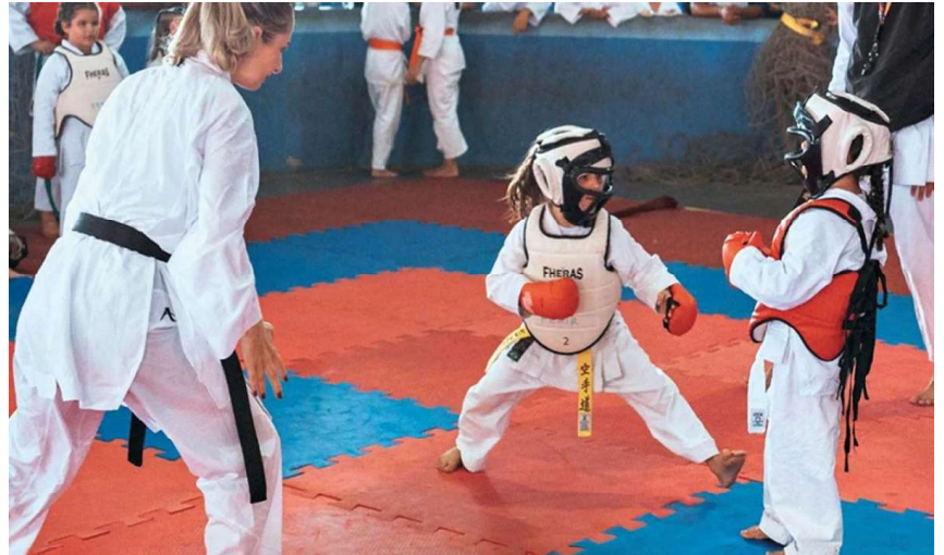
Competição interestilos marca início do estadual 2026 e deve movimentar o esporte no fim de semana.