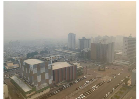
Estruturas atendem diretrizes do CNJ e buscam dar mais agilidade e especialização às demandas climáticas.

dar maior celeridade aos processos, além de aprimorar a qualidade das decisões judiciais em temas relacionados ao meio ambiente e às mudanças climáticas.