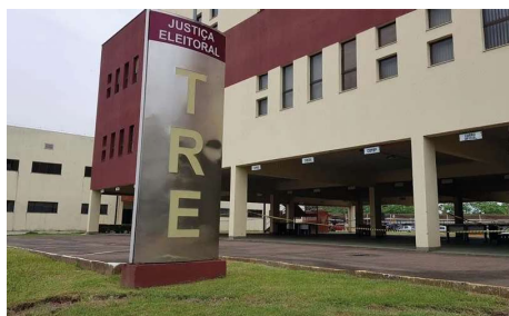
Irregularidades na prestação de contas de 2023 levaram à aplicação de multa superior a R$ 93 mil.

TRE-RO barra contas do PL e impõe devolução de recursos com multa superior a R$ 93 mil