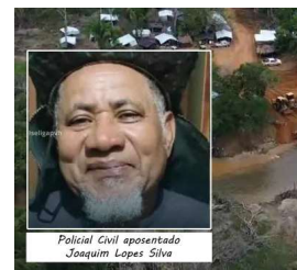
Trabalhadores ficam feridos e desaparecidos após invasão.

Em resposta ao episódio, tropas da Polícia Militar foram mobilizadas para reforçar o