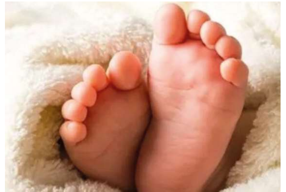
A prisão ocorreu no hospital em que a criança está internada, após ela dar entrada com ferimentos graves.