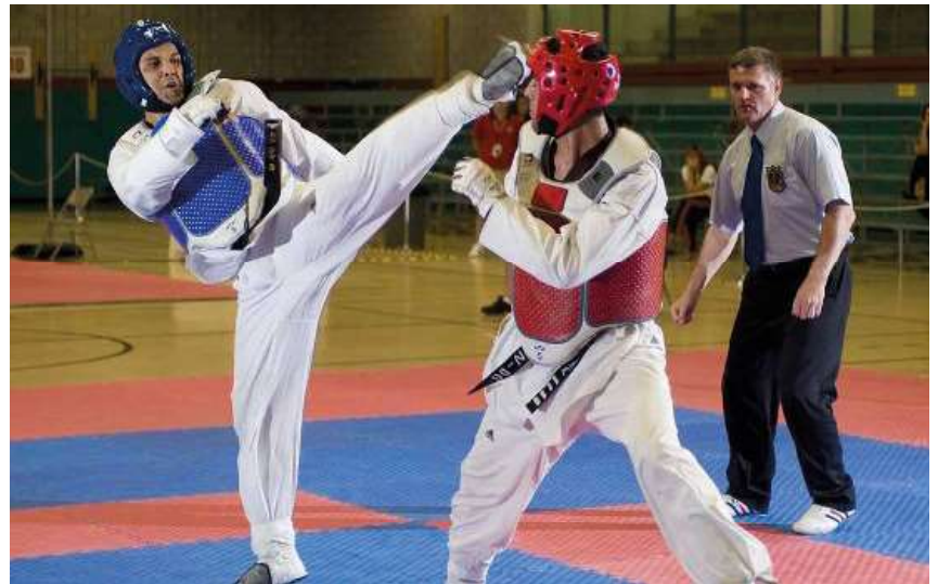
Competição marca primeira etapa do ranking estadual e serve como seletiva para torneios nacionais.

As disputas incluem as categorias de kyorugi (luta), organizadas por peso