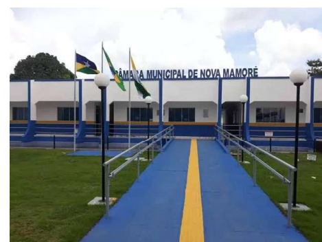
Enquanto plano dos servidores levou semanas de debate, projeto que amplia estrutura interna foi aprovado no mesmo dia e com questionamentos.

Antes disso, o projeto chegou a ser retirado de pauta, mesmo após a Câmara afirmar inicialmente que não havia entraves técnicos. Dias depois, vereadores passaram a apontar riscos orçamentários e necessidade de ajustes, em meio