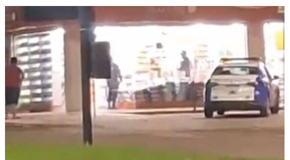
De acordo com informações da Polícia Militar, a guarnição foi acionada para averiguar.

Diante dos fatos, o indivíduo foi encaminhado à Delegacia de Polícia, onde ficou à