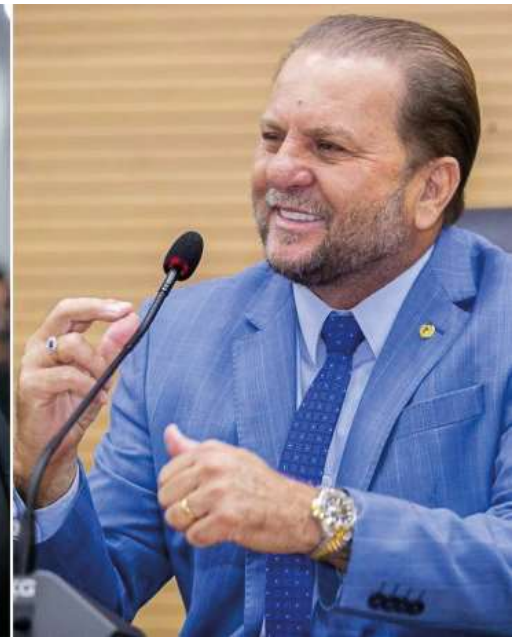
Partido aponta pedido implícito de votos em publicação nas redes sociais antes do prazo legal.