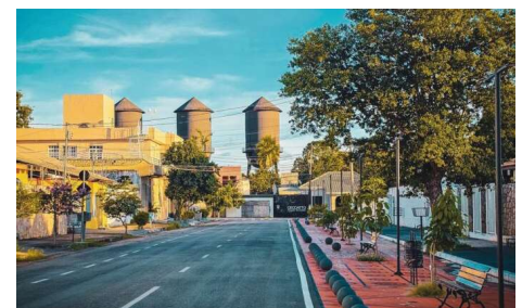
Foram captados mais de R$ 250 milhões, o maior volume de recursos já destinado ao município pelo programa.

Porto Velho volta ao PAC e garante mais de R$ 250 milhões em investimentos federais