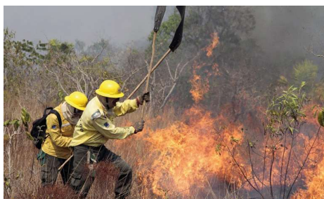
Medida prevê contratação de equipes temporárias em seis municípios para intensificar prevenção e combate em 2026.

Ibama autoriza contratação de brigadistas para combate a incêndios florestais em Rondônia