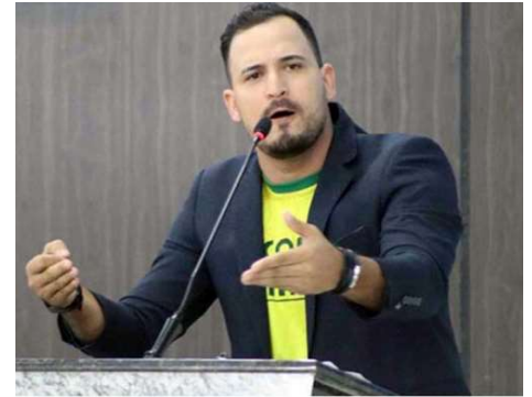
Justiça Eleitoral confirma multa de R$ 10 mil após falas consideradas desinformativas durante campanha em Ariquemes.

A decisão do TRE-RO também sinaliza um posicionamento mais rigoroso da Justiça Eleitoral no combate à desinformação durante o período eleitoral, especialmente em um cenário de ampla circulação de conteúdos em redes sociais