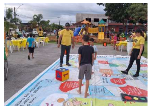
Atividade interativa reuniu crianças e adultos em campanha de conscientização sobre segurança no trânsito.

A ação reforça o compromisso do Detran-RO com a educação para o trânsito e a preservação da vida, aproximando os órgãos de trânsito da comunidade por meio de atividades educativas e inclusi-