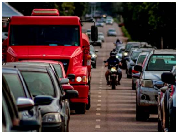
Processo mais flexível permite início por aplicativo e reduz carga mínima de aulas práticas.

O Departamento Estadual de Trânsito de Rondônia reforçou as mudanças no processo de obtenção da primeira Carteira Nacional de Habilitação, conforme a Resolução nº 1.020/2025 do Conselho Nacional de Trânsito, em vigor