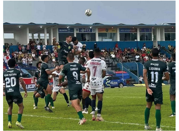
Com atuação dominante no Aluizio Ferreira, Locomotiva faz 4 a 0 e embala sequência positiva também na Copa Norte.

Do lado do Galvez, o momento exige reação imediata. A equipe acreana ainda não pontuou e apresenta dificuldades tanto defensivas quanto na criação de jogadas, o que aumenta a pressão