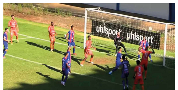
Com "lei do ex", equipe rondoniense soma ponto importante e mantém disputa acirrada no Grupo A2 da Série D.

O empate fora de casa pode ser considerado estratégico, mas está longe de ser ideal para quem pretende brigar pela liderança. O Guaporé mostrou capacidade de competir longe de seus do-