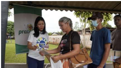
Ação estadual reúne atendimentos de saúde, documentação e assistência social em um só local.

A população de Ouro Preto do Oeste receberá, nos dias 11 e 12 de abril, mais uma edição do programa Rondônia Cidadã. A ação será realizada na Escola Estadual Monteiro Lobato, no bairro Liberdade, com oferta de diversos serviços gratuitos à comunidade.