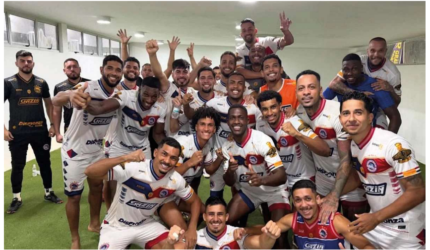
Gol aos 43 minutos do segundo tempo garante triunfo da Locomotiva após empate e pressão adversária em Boa Vista.

liderança da competição e mantém uma campanha consistente, demonstrando organização tática e capacidade de reação mesmo fora de casa.