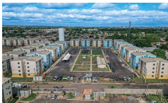
Entrega amplia o número de unidades disponibilizadas na atual gestão.

As moradias estão distribuídas em dois empreendimentos. O Porto Madeiro V conta com 288 unidades sob responsabilidade do município. Já o Porto Madeiro II soma 304 unidades executadas