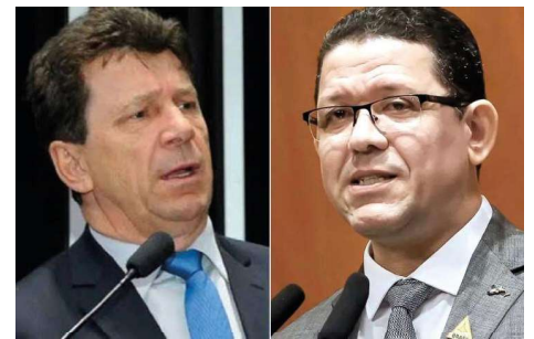
Demissão de assessores ligados ao gabinete do vice-governador aprofunda tensão política no Executivo estadual.