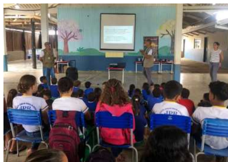
A iniciativa tem como objetivo promover a conscientização ambiental por meio de ações educativas, com orientações voltadas à prevenção de queimadas e incêndios florestais.

A iniciativa tem como objetivo promover a conscientização ambiental por meio de ações educativas, com orientações voltadas à prevenção de queimadas e incêndios florestais, além da fixação de cartazes e da distribuição de cartilhas e