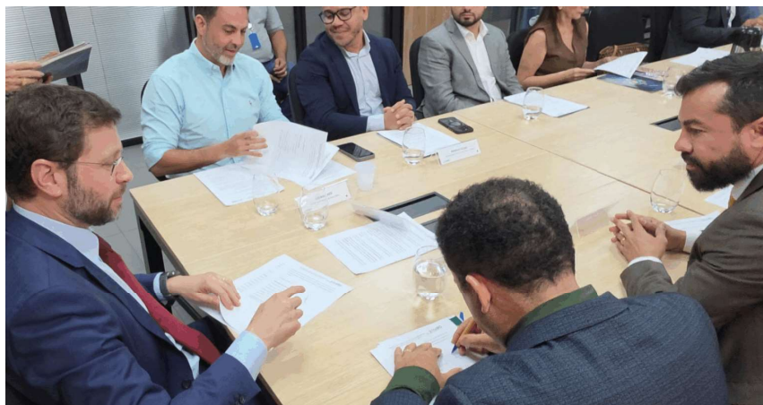
Iniciativa reúne órgãos de controle e gestão municipal para fortalecer políticas públicas de saúde.

O documento reúne ações integradas entre a Prefeitura, a Secretaria Municipal de Saúde, instituições acadêmicas e hospitalares, além de órgãos de controle, com metas voltadas à ampliação do pré-natal, qualificação de protocolos