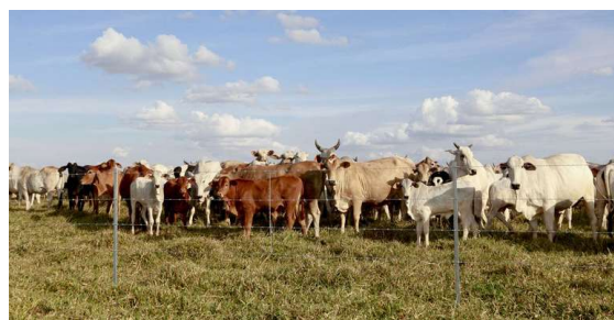
Em análise a vários cadastros junto ao Idaron, o MP identificou a existência de criação bovina em unidades de conservação.

Foram cumpridos mandados de busca e apreensão em 14 alvos, entre pessoas físicas