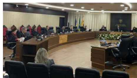
"O objetivo é trazer elementos para ajudar a solucionar o problema. As pessoas precisam ser ouvidas para saber o que está acontecendo".

que o julgamento tenha grande repercussão no estado, uma vez que a decisão poderá impactar outras áreas protegidas em Rondônia, servindo como parâmetro para futuras medidas envolvendo ocupação, produção rural e preservação ambiental.