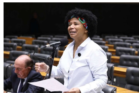
Deputada ressaltou que acesso a terapias modernas através do SUS, é uma conquista para os pacientes.

Apesar do avanço, especialistas ressaltam que a implementação efetiva da medida dependerá da definição de critérios clínicos, da atualização dos protocolos e da capacidade de financiamento