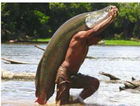
A proposta busca reduzir fraudes e estabelecer novos critérios para acesso ao benefício.

De acordo com a medida, o interessado deverá ter solicitado o benefício dentro dos prazos estabelecidos para ter direito ao recebimento retroativo. O pagamento será efetuado em até 60 dias após a regularização da situação do pes-