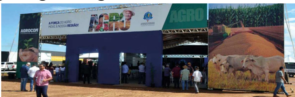
Evento reúne produtores, empresários e especialistas em programação voltada à inovação e desenvolvimento econômico.

A Assembleia Legislativa de Rondônia também participa do evento, oferecendo estrutura e promovendo capacitação por meio da Escola do Legislativo, com palestras gratuitas voltadas à qualificação dos participantes e à disseminação de conhecimento técnico.