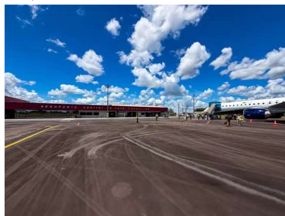
O governo de Rondônia já investiu mais de R$ 80 milhões nos aeroportos sob sua responsabilidade.

Para o governador de Rondônia, Marcos Rocha, o reforço na malha aérea representa um avanço importante para o estado. "A ampliação dos voos é fundamental para melhorar a conexão de Rondônia com outros centros do país. Isso fortalece a economia, facilita o deslocamento das pessoas e contri-