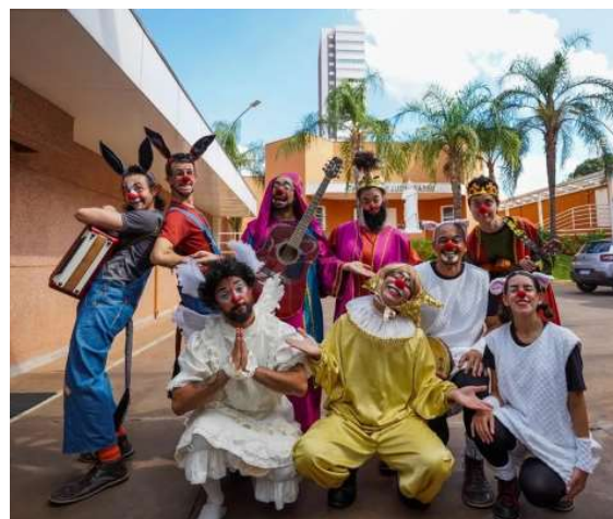
Projeto do Instituto Sociocultural do Hospital de Amor une arte e alegria nos corredores da unidade.

cultura, esporte, educação e humanização ao cuidado em saúde. Seus projetos impactam diariamente pacientes, familiares, colaboradores e comunidades atendidas pelo Hospital de Amor em todo o Brasil. Com