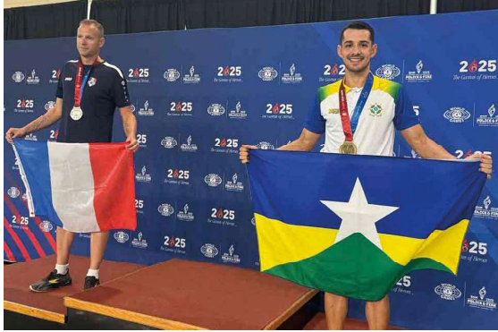
O objetivo destas participações é consolidar o protagonismo do estado no panorama esportivo global.

Atletas rondonienses alcançaram lugares de destaque em competições nacionais e internacionais de judô, jiu-jitsu, karatê e triatlo, realizadas entre os dias 22 e 29 de março de 2026. Os eventos aconteceram no Brasil (Bahia e Mato Grosso), nos Estados Unidos da América (Flórida) e na ilha de Malta, sul da Europa. As conquistas nestas