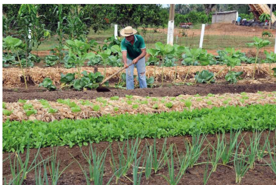
A proposta é reduzir o tempo de análise e facilitar o acesso dos produtores às linhas de crédito rural.

Agricultores familiares de Rondônia terão mais facilidade para acessar crédito rural após parceria firmada entre a Emater-RO e o Banco da Amazônia. O acordo permite que propostas de financiamento sejam elaboradas diretamente nas propriedades, com uso de ferramentas digitais, reduzindo o tempo de análise e a burocracia.