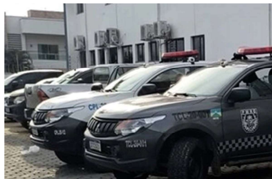
Cinco suspeitos foram conduzidos, quatro homens e uma mulher até a Unidade Integrada de Segurança Pública (Unisp).

A operação contou com apoio do Canil Municipal e de diversas guarnições, sendo