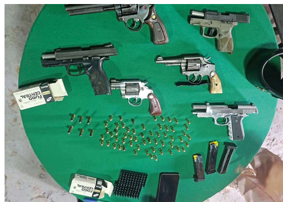
Abordagem inicial na região central da capital levou à descoberta de arsenal escondido e novas diligências no interior.

novo revólver calibre .38 foi encontrado no mesmo imóvel. Diante dos fatos, os dois suspeitos foram detidos e conduzidos à Central de Flagrantes de Porto Velho, com