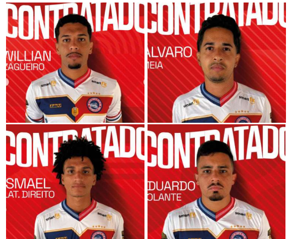
Novos atletas chegam para aumentar competitividade e ampliar opções táticas da equipe.

A expectativa da torcida é de que os re-