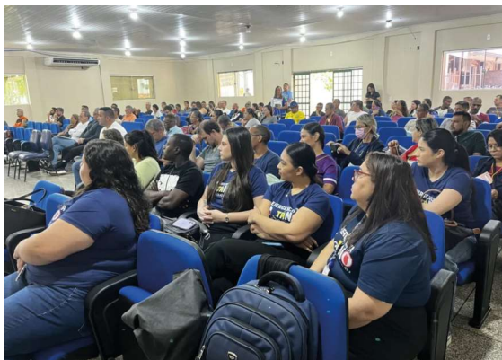
Evento teve como foco a capacitação em primeiros socorros e o fortalecimento das práticas pedagógicas no ambiente escolar.

O governo de Rondônia promoveu, na terça-feira (31), em Porto Velho, um encontro voltado aos professores de Educação Física da Rede Estadual de Ensino, com foco na capacitação em primeiros socorros e no fortalecimento das práticas pedagógicas no ambiente escolar.