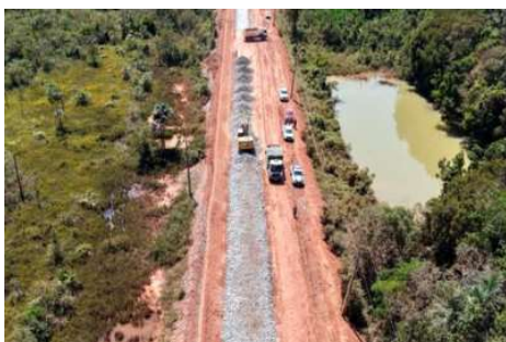
Decisão liminar suspende por 70 dias pregões do Dnit e exige manifestação do Ibama sobre possível dispensa de licenciamento no “trecho do meio” da rodovia.

Os processos de contratação para obras no chamado “trecho do meio” da BR-319 foram interrompidos por determinação da Justiça Federal do Amazonas, que estabeleceu a suspensão das licitações pelo prazo de 70 dias. A medida atinge diretamente um projeto estimado em R$ 678 milhões e impede, nesse intervalo, a formalização de contratos e o avanço das intervenções previstas na rodovia que conecta Manaus a Porto Velho.