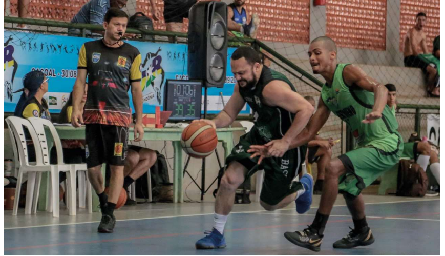
Programa assegura auxílio financeiro mensal a atletas, paratletas, surdoatletas, atletas-guia, tappers e técnicos esportivos

A gestão do programa ficará sob responsabilidade da Secretaria Municipal de Turismo, Esporte e Lazer (Semtel), que