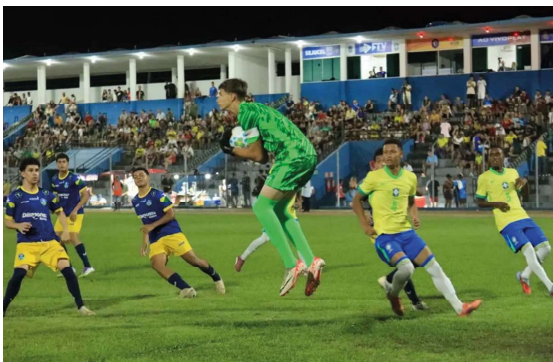
Competição principal das categorias de base deve começar no próximo mês de junho.

O Departamento de Competições (DCO) da Federação de Futebol do Estado de Rondônia abriu o período de inscrições para o Campeonato Rondoniense Sub-20. Os clubes interessados têm até às 18h do dia 6 de maio para confir-