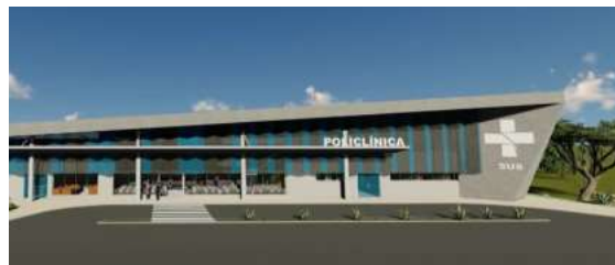
Nova unidade será erguida na Avenida José Vieira Caúla com Andréia, no bairro Cuniã.

Para maio, está prevista a abertura da licitação de R$ 90 milhões para o serviço de macrodrenagem e manejo sustentável da água: contrato que promete mudar a forma como a população enfrenta os problemas causados pelas chuvas na cidade. Ainda no