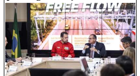
Motoristas terão 200 dias para quitar débitos e evitar penalidades.

O governo federal suspendeu por 200 dias cerca de 3,51 milhões de multas aplicadas por falta de pagamento no sistema de pedágio eletrônico “free flow”. Durante esse período, os motoristas poderão regularizar os débitos e, se quitarem as tarifas até 16 de novembro, também poderão recuperar os pontos perdidos na CNH.