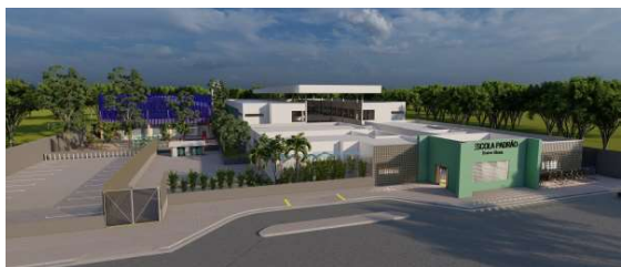
Escola no Bairro Novo terá capacidade para atender 540 alunos por turno.

“São obras estruturantes que irão revolucionar a forma com que o cidadão vive a cidade de Porto Velho. Esse é o retrato da atual gestão, que se dedica a um trabalho de qualidade, empenhado em entregas que tragam resultado direto à sociedade”.