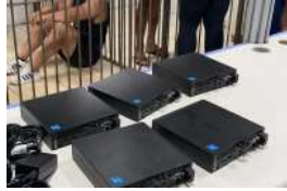
A polícia investiga a possível participação de outros envolvidos, inclusive com suspeita de facilitação interna.

Com o impacto, a mulher foi arrastada por vários metros na pista, em uma cena que chocou quem passava pelo local. O Serviço de Atendimento Móvel de Urgência