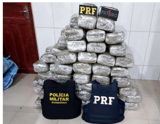
O condutor foi detido no local e encaminhado à delegacia, juntamente com o veículo e o material apreendido.

A ação reforça o compromisso das forças de segurança com o enfrentamento ao tráfico, retirando uma expressiva quantidade de droga de circulação e contribuindo para a manutenção da ordem