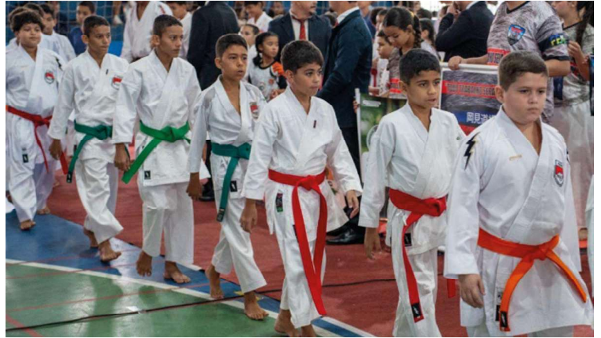
Evento movimentou o Ginásio Adão Lamota, com disputas nas categorias kata e kumite durante dois dias

Mesmo diante de desafios logísticos, a organização garantiu a realização do torneio, que segue incentivando o esporte e revelando novos talentos no cenário regional.