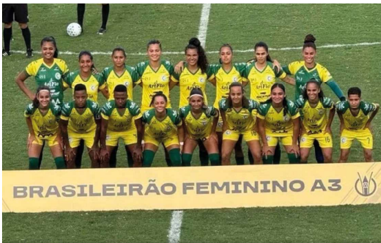
Tigresas seguem firmes na competição e levam próximo jogo para Ji-Paraná

O Rolim de Moura Esporte Clube entrou em campo neste domingo (26) já classificado para as oitavas de final do Campeonato Brasileiro Feminino