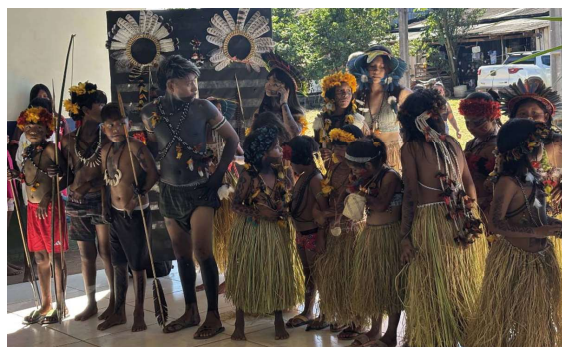
A ação teve apoio da AMPB (Autarquia Municipal de Esporte, Cultura e Turismo), fortalecendo iniciativas voltadas à cultura e ao esporte no município.

A Prefeitura de Pimenta Bueno participou e apoiou, no último domingo (26), o Festival de Cultura e Jogos Indígenas realizado na Aldeia Tenente Marques – João Bravo, território do povo Cinta Larga.