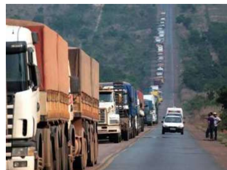
Operação especial amplia monitoramento e suspende obras para garantir segurança e fluidez no tráfego.

A Nova 364 administra 686,7 km da BR-364, entre Porto Velho e Vilhena, além de 34 km do Expresso Porto. Considerada uma via estratégica para o es-