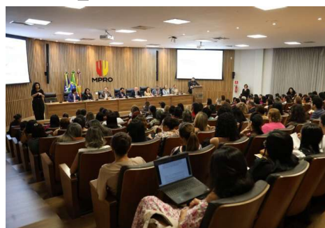
Uma importante articulação institucional voltada ao fortalecimento das políticas públicas sociais foi oficializada em Guajará-Mirim.

Uma importante articulação institucional voltada ao fortalecimento das políticas públicas sociais foi oficializada em Guajará-Mirim na última sexta-feira, 24 de abril de 2026.