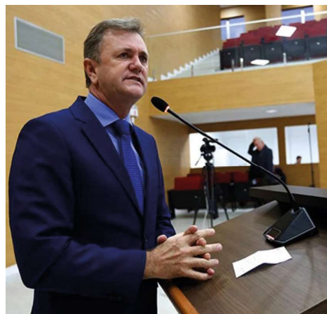
Recurso será utilizado na compra de veículo para atender demandas da Semcelt.

O município de Itapuã do Oeste foi contemplado com uma emenda parlamentar no valor de R$ 132 mil, destinada à aquisição de um veículo utilitário para a Secretaria Municipal de Esporte, Cultura, Lazer e Turismo (Semcelt).