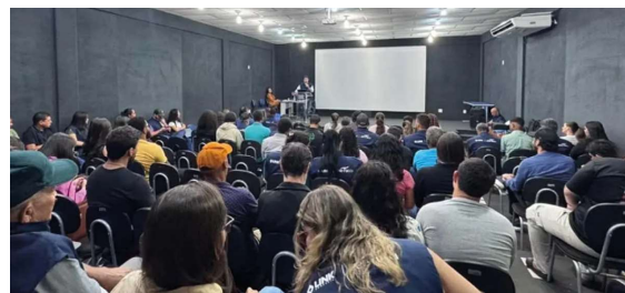
O evento reúne gestores públicos, técnicos e especialistas para debater estratégias voltadas ao fortalecimento da gestão ambiental e à integração entre instituições públicas.

Para o governador de Rondônia, Marcos Rocha, o encontro fortalece a união entre os municípios na construção de soluções ambientais efetivas. “Este encontro fortalece a parceria institucional e o compromisso conjunto com a preserva-