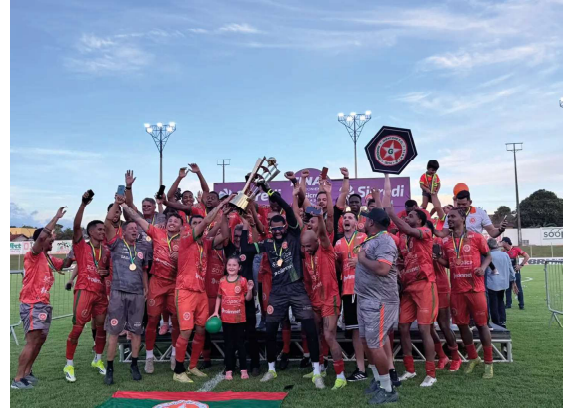
O Guaporé conquistou título inédito da competição.

Em 2026 a FFER e CBF também entregaram obras de revitalização de vestiários,