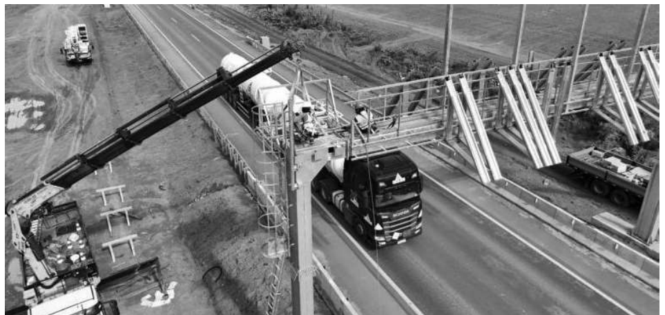
Sistema eletrônico de pedágio já soma milhões de usuários inadimplentes e exige atenção dos motoristas.

O julgamento deve ocorrer nos próximos meses. Caso a decisão seja confirmada, a retotalização dos votos poderá provocar mudanças na composição da Câmara ainda no primeiro semestre de 2026.