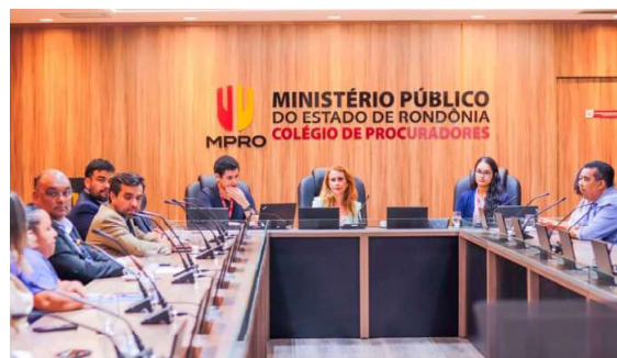
Operação Rastro Zero cumpre mandado de busca e apreensão contra grupo investigado em Porto Velho.

A ação do Ministério Público visa proteger o direito fundamental à mobilidade e à saúde, garantindo que as medidas políticas e extrajudiciais em andamento não prejudiquem o cidadão que necessita do transporte intermunicipal para tratamentos vitais, como os realizados no Hospital do Amor. A reunião, coordena-