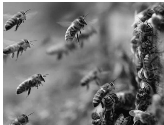
Mais de 400 produtores já estão cadastrados; ação é estratégica para vigilância, produção e sanidade das colmeias no estado.

pios com maior número de registros, Cacoal lidera, com 88 unidades cadastradas — sendo 66 apiários e 22 meliponários. Na sequência aparecem Porto Velho, com 51 (28 apiários e 23 meliponários) e Vilhena, com 39 (33 apiários e 6 meliponários). Também se destacam Pimenta Bueno, com 33 cadastros, e Rolim de