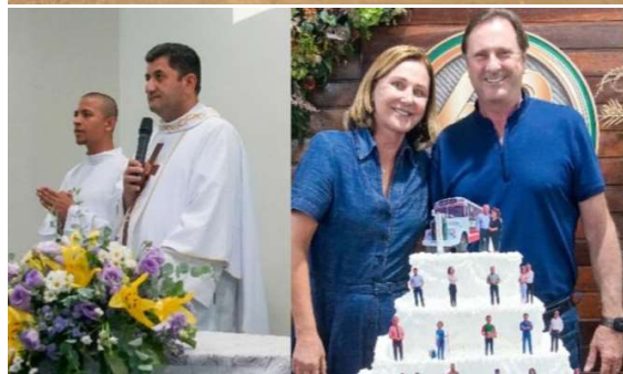
Colaboradores, diretores e empresários se reúnem em momento de fé, gratidão e reconhecimento pela trajetória da empresa.

As comemorações pelos 62 anos da Eucatur, uma das empresas mais tradicionais do