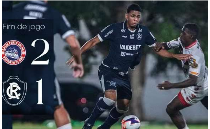
Equipe rondoniense vence novamente o adversário e ganha confiança para sequência da competição.

Com o resultado, o Porto Velho ganha confiança para a sequência da competição e busca manter o bom momento dentro de casa, onde tem apre-