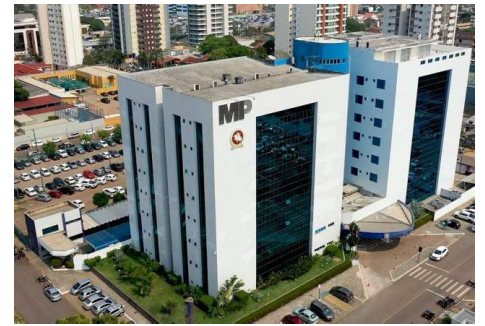
Indicação integra processo do quinto constitucional e segue para análise do Tribunal de Justiça.

A vaga a ser preenchida decorre de aposentadoria de membro do Tribunal, e a definição do novo desembargador é aguardada com expectativa no meio jurídico, por representar impacto direto