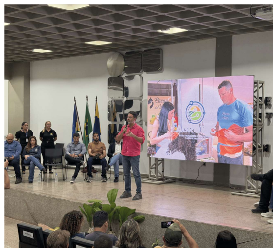
Evento reuniu produtores, instituições e empreendedores em um ambiente de oportunidades, inovação e valorização da agricultura familiar.

A Feira Agrotec 2026 acontece de 8 a 12 de julho, no Complexo da Estrada de Ferro Madeira-Ma-