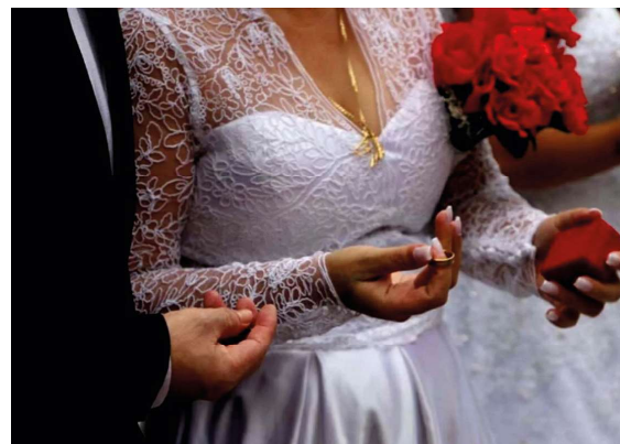
Cerimônias gratuitas garantem direitos e promovem cidadania a casais do interior.

mento simbólico para os participantes, promovendo cidadania, fortalecimento dos vínculos familiares e inclusão social por meio do acesso à Justiça.