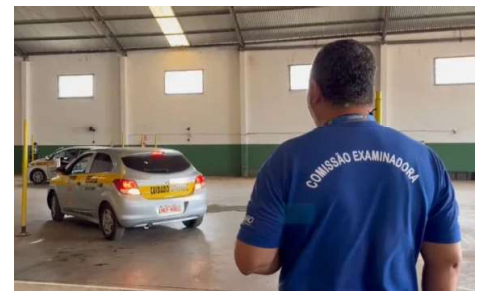
Atualização busca a padronização dos processos e controle sobre profissionais que atuam de forma autônoma na instrução prática de direção.

Segundo o Detran, a medida busca aumentar a segurança e a qualidade no ensino da direção, além de ampliar oportunidades de trabalho para profissionais do setor. No entanto, a portaria também estabelece restrições, proibindo a atuação de servidores do próprio órgão, profissionais com dedicação exclu-