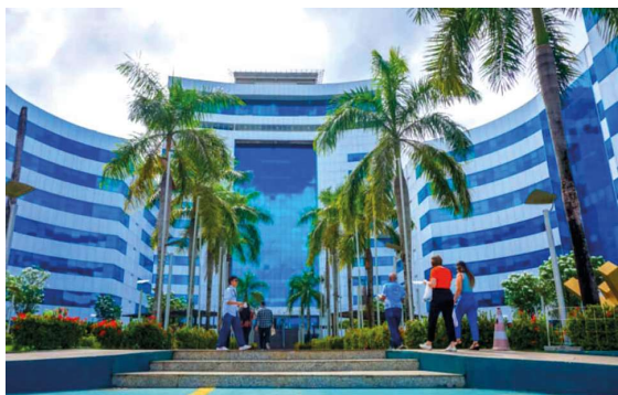
A ação tem como foco o fortalecimento da pós-graduação, da pesquisa e da inovação na região Norte.

O governo de Rondônia, por meio da Fundação de Amparo ao Desenvolvimento das Ações Científicas e Tecnológicas e à Pesquisa (Fapero), passou a integrar a execução do Programa Rede de Pesquisa e Desenvolvimento da Amazônia Legal, iniciativa da Coordenação de Aperfeiçoamento de Pessoal de Nível Superior (Ca-