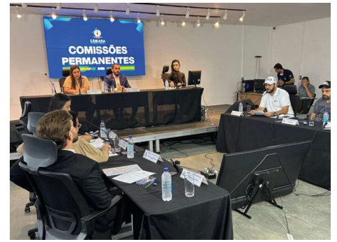
Projetos tratam políticas sociais, isenção de impostos e fiscalização de serviços públicos.