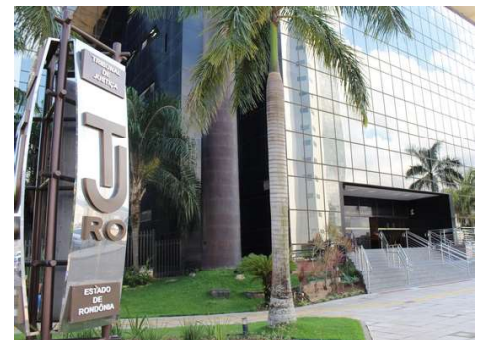
Percentual é de 4,26%, com efeitos a contar de 1º de março de 2026 e vai em acordo com Lei de Responsabilidade Fiscal.

Caso sancionada, a medida deverá ser implementada ainda neste exercício