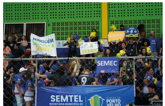
Evento promove integração, saúde e valorização dos servidores municipais.

Para muitos, a competição representa não apenas um momento