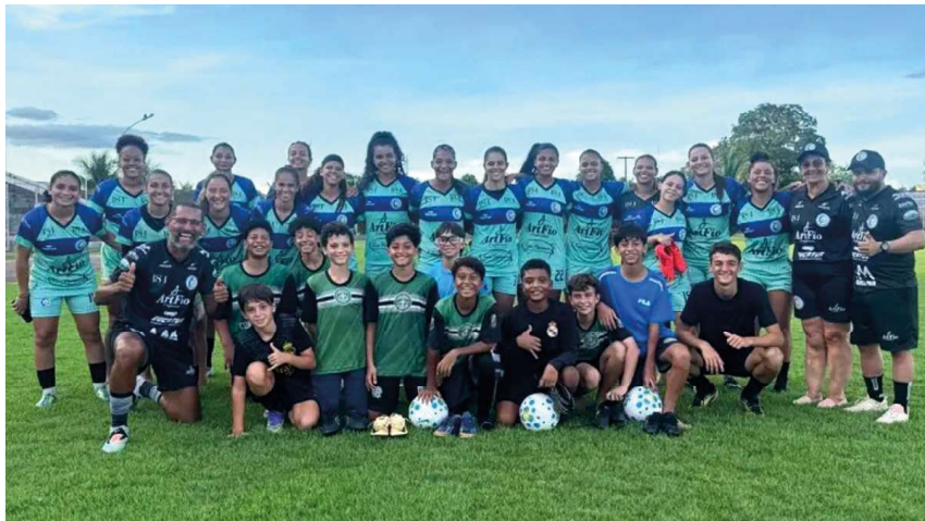
A atividade foi marcada por muita intensidade, troca de experiências e, principalmente, pelo espírito esportivo.

ção técnica, o trabalho também envolve aspectos físicos e psicológicos, fundamentais para manter o rendimento das atletas ao longo da partida. A comissão técnica tem intensificado os treinos visando resistência, organização tática e tomada de decisão em momentos de pressão.