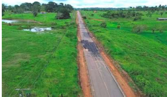
RO 470, de Mirante da Serra a Nova União, recebe manutenção asfáltica executada pelo DER.

Com ações estratégicas, o governo de Rondônia por meio do Departamento Estadual de Estradas de Rodagem e Transportes (DER-RO), está garantindo mais segurança e qualidade no tráfego, com serviços