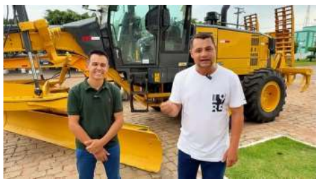
A nova motoniveladora “Patrol”, foi destinada pelo governo federal por meio do senador Jaime Bagattoli.

A prefeitura do município de Chupinguaia, junto a gestão do prefeito Dr. Wesley Araújo (PP), e do vice-prefeito Eliezer Paraíso (PSD), foi adquirida uma motoniveladora, conhecida como “Patrol”, através de uma emenda parlamentar do senador Jaime Bagattoli (PL), no valor de R$ 990 mil, com foco no programa “Caminho Rural” e a contrapartida do município no valor de R$ 442 mil, totalizando para a compra da Patrol no valor de R$1.432 mil, é uma ação para fortalecer a infraestrutura rural e urbana do município.