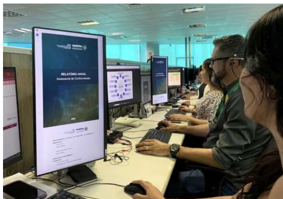
O documento reúne as principais iniciativas, resultados e avanços em governança no governo de Rondônia.

Com o objetivo de dar transparência às ações desenvolvidas ao longo do ano, a Superintendência Estadual de Tecnologia da Informação e Comunicação (Setic) divulgou o Relatório Anual da Assessoria de Conformidade referente a 2025. O documento reúne as principais iniciativas, resultados e avanços em governança, integridade e proteção de dados no governo de Rondônia. Um dos principais destaques