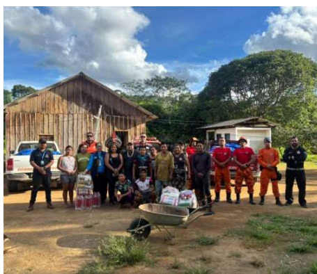
Diagnóstico socioambiental e Econômico permitiu identificar os impactos causados pelas cheias e a necessidade de apoio emergencial às famílias.