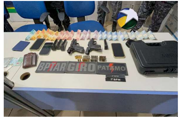
A Polícia Militar prendeu vários suspeitos e apreendeu armas de fogo, munições e dinheiro durante operação realizada na noite desta quarta-feira (18), em Porto Velho.

Outro ocupante do veículo informou ser do estado do Rio de