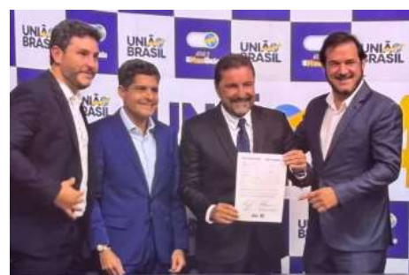
A articulação busca fortalecer a atuação política tanto na capital quanto no interior de Rondônia.

Nos bastidores, alterações recentes no primeiro escalão do governo estadual vêm sendo associadas por