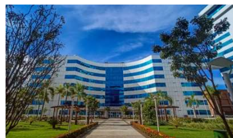
Entrega de veículos será no Palácio Rio Madeira na próxima segunda-feira (23) e prevê a modernização da frota utilizada nas atividades administrativas, educativas e de fiscalização em todo o estado.

Três tipos de veículos serão disponibilizados ao órgão, que vão atender diferentes demandas operacionais do departamento, incluindo atividades administrativas, transporte institucional e ações de fiscalização. Entre os modelos estão 46 caminhonetes administrativas, destinadas ao uso geral no perímetro urbano e em viagens intermunicipais, especialmente nas atividades de educação de trânsito, transporte de servidores e apoio às comissões examinadoras.