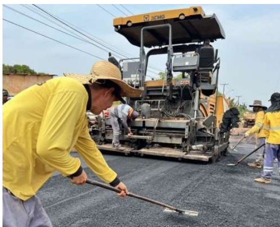
Medidas técnicas consideram solo, umidade e drenagem para aumentar a durabilidade do pavimento em Porto Velho.

Porto Velho vem adotando um método técnico na preparação das vias que vão receber pavimentação definitiva, tão logo garantindo mais resistência e durabilidade ao as-