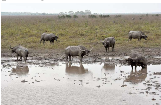
Ação inédita busca conter impactos ambientais causados por espécie exótica em unidades de conservação.

O Instituto Chico Mendes de Conservação da Biodiversidade (ICMBio) iniciou um projeto piloto para erradicar cerca de 10% dos aproximadamente 5 mil búfalos que vivem de forma descontrolada em áreas protegidas de Rondônia. Os animais, que não são nativos do Brasil, têm provocado impactos significativos à fauna, à flora e ao equilíbrio ecológico dos campos alagados da região.