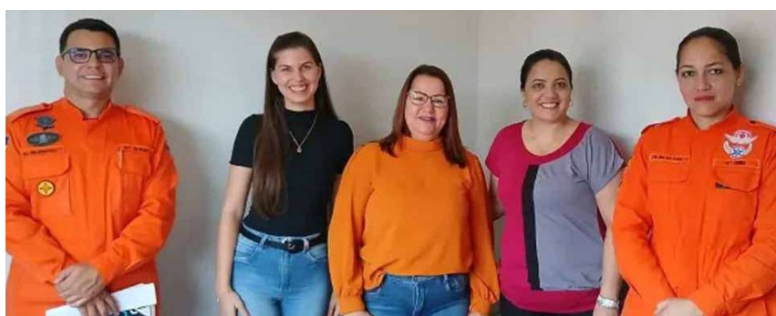
A Lei nº 4.603/2025 foi sancionada com o objetivo de autorizar a formalização dessa cooperação.

Por meio do convênio, o município poderá contribuir com o custeio de gêneros alimentícios, uniformes e demais