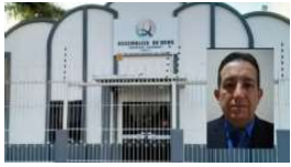
O suspeito teria ido ao local para atacar a ex-esposa.

Um homem foi preso no último domingo (9), no município de Castanheiras (RO) após invadir uma igreja e assassinar um fiel que tentou intervir no ataque contra a ex-mulher.