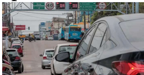
Diálogo buscou subsídios para relatório final sobre direitos dos trabalhadores.

Um grupo de deputados federais esteve em Porto Velho para debater a regulamentação do trabalho de motoristas e entregadores de aplicativos, ouvindo trabalhadores