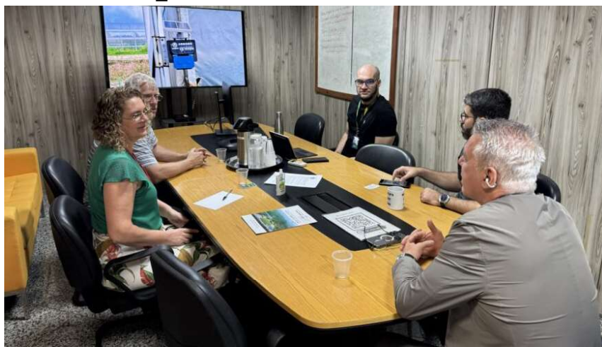
Foram apresentadas oportunidades de cooperação com a China voltadas à agricultura inteligente.

Implementação de sistemas de sensoriamento remoto e coleta de dados em tempo real; Expansão da conectividade rural com soluções baseadas em IoT; Aplicação de tecnologias para aumento de produtividade e