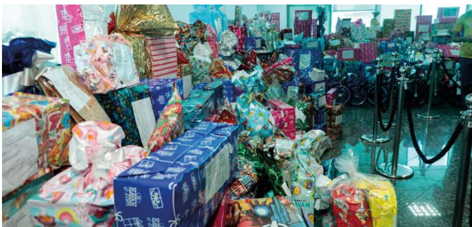
Em 2024, foram mais de 2.900 presentes doados pelos servidores do estado para alunos da rede pública na campanha dos Correios.

Para o governador de Rondônia, Marcos Rocha, o projeto é importante por transformar sonhos em realidade, com o atendimento das cartas, endereçadas ao Papai Noel. Por meio da mobilização, não apenas dos funcionários da empresa em todos os estados, mas também de instituições públicas e outras iniciativas privadas que abraçam a ação, com o incentivo à “adoção” de uma criança com o atendimento do pedido em sua cartinha e também por incentivar a escrita, o desenvolvimento cognitivo e o fortalecimento de vínculos afetivos. “Convidamos a todos os servidores e também a população de Rondônia para juntos