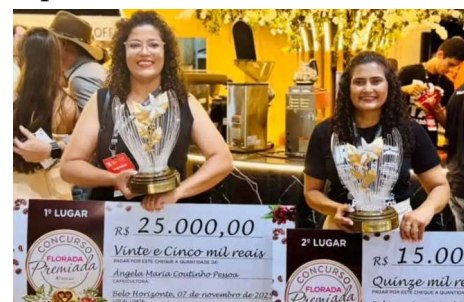
Produtoras de Rondônia conquistam 1º e 2º lugares no maior concurso feminino de cafés do Brasil.

A conquista coloca Rondônia em posição de destaque no cenário nacional e reforça o protagonismo das mulheres no agronegócio, especialmente no segmento de cafés especiais.