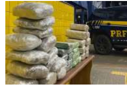
Um homem e uma mulher foram presos.

A Polícia Rodoviária Federal em Rondônia, no último domingo (9), no município de Vilhena, apreendeu 22,6 kg de cloridrato de cocaína e 19,35 kg de maconha, durante a realização de comando de fiscalização na unidade operacional. Ao abordar um veículo de passeio, a partir da realização de téc-