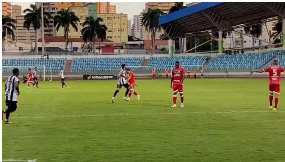
Equipe goiana bateu time rondoniense por 2 a 0.