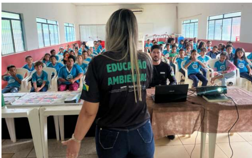
Os trabalhos enfatizaram a prevenção às queimadas, orientações em propriedades rurais.