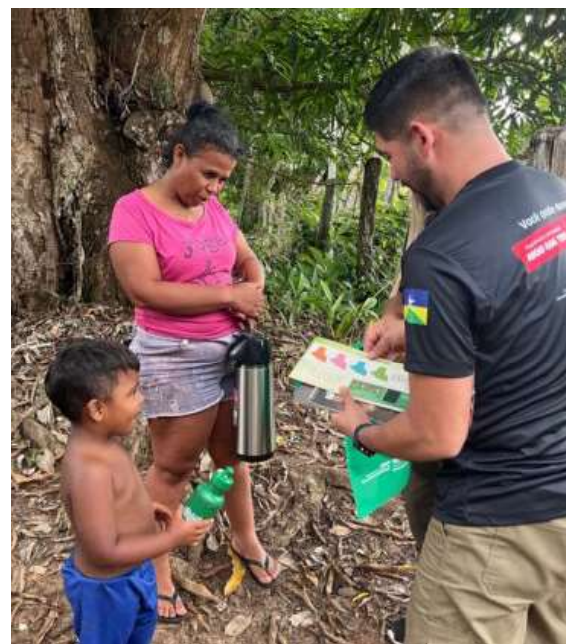
Além das palestras, a equipe realizou busca ativa junto à população.

ções públicas e privadas, e indivíduos na mitigação dos impactos causados pelo fogo. Através da combinação de ações educativas, políticas públicas e tecnologias, o projeto cria uma rede colaborativa capaz de transformar comportamentos, promover gestão responsável dos recursos naturais e reduzir os índices de queimadas de forma sustentável.