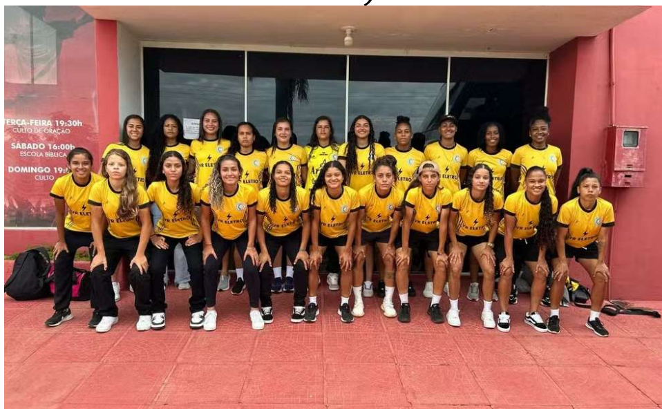
Meninas de Rolim meteram 10 a 0 pra cima do time amazonense.

Com o resultado, o Rolim de Moura soma três pontos e ocupa a segunda posição na classificação, atrás do líder Galvez, do Acre, que tem seis pontos. O Tarumã, do Amazonas, também soma três pontos, enquanto o