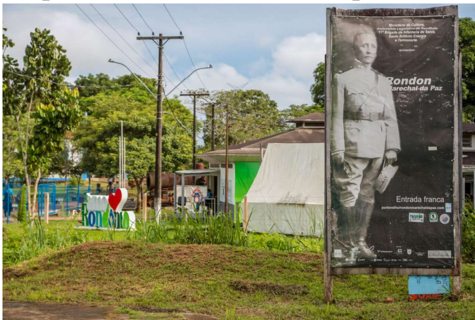
O espaço oferece visitas guiadas por monitores e um mergulho na história da Amazônia