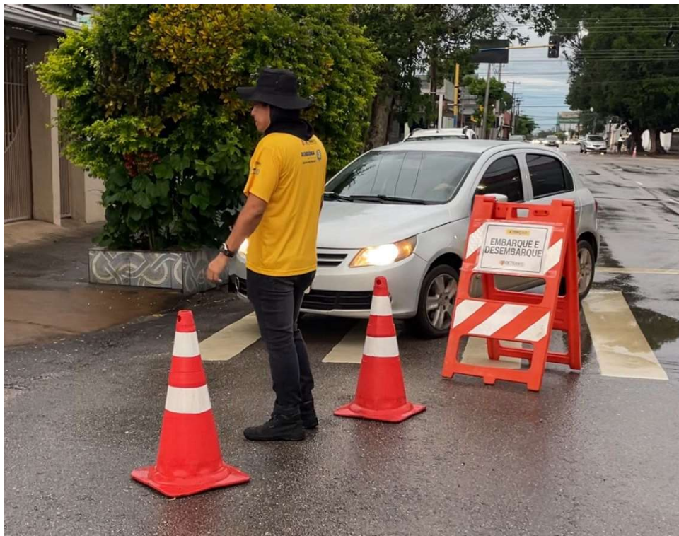
Espaços estão devidamente sinalizados para facilitar visualização

Avenida Farquar, entre Rua Duque de Caxias e Rua Marcos Auré-