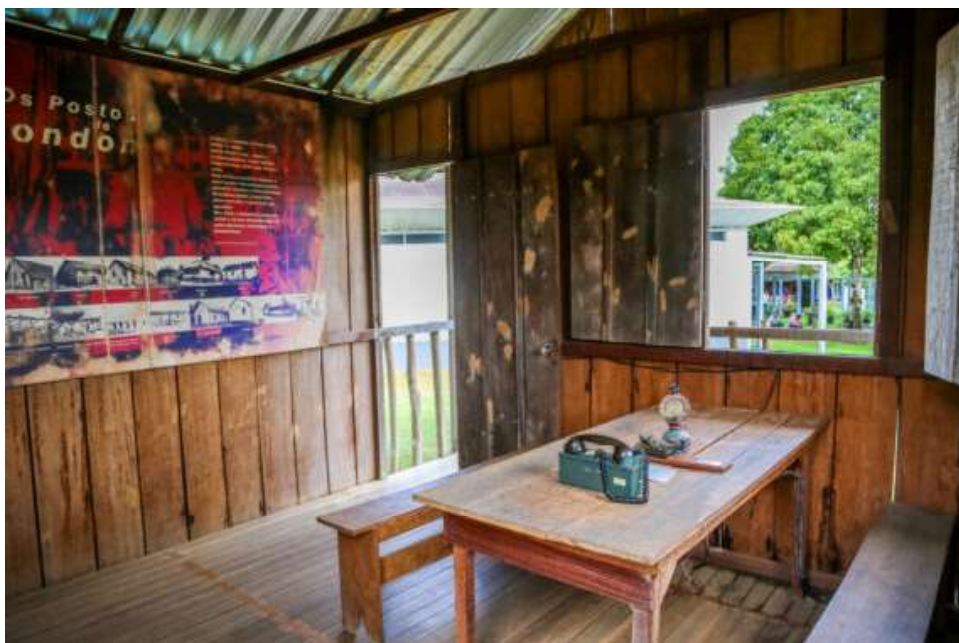
Entre as mais de 400 peças históricas está o antigo telégrafo usado por Rondon em suas expedições

Com visitas guiadas por soldados da 17ª Brigada de Infantaria de Selva, o Memorial Rondon continua se consolidando como um dos principais pontos turísticos de Rondônia. Para quem busca cultura, história e um refúgio tranquilo durante o Carnaval, o espaço é uma excelente alternativa.