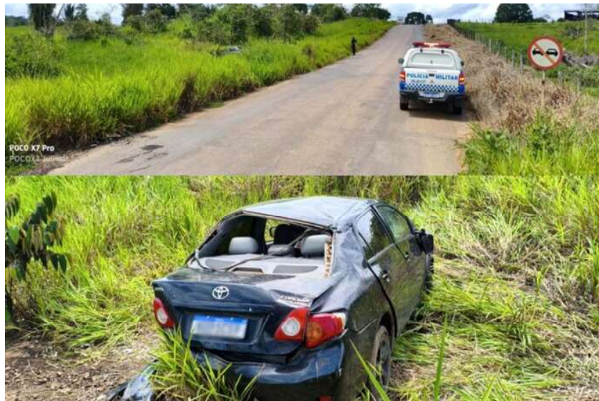
A guarnição de serviço foi acionada para comparecer ao Hospital Municipal de Theobroma.

A condutora sofreu escoriações em uma das pernas e relatou dores na região torácica, sendo encaminhada para exames médicos para avaliação da extensão das lesões. Sua filha, também estava no veículo e apresentou vermelhidão no pescoço,