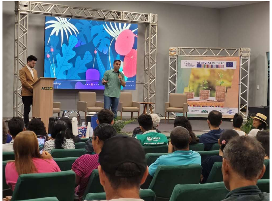
Evento contou com excelente presença de público

ponente 1, o programa administra fundos para a implementação de projetos inovadores de associações de pequenas empresas para promover práticas sustentáveis no setor privado. Esta etapa é liderada pela Sequa, uma organização alemã sem fins lucrativos que opera em todo o mundo com o objetivo de promover o setor privado.