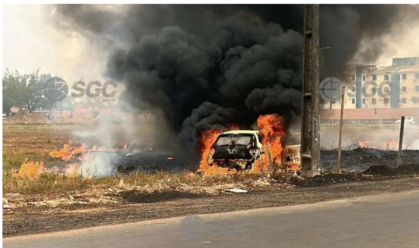
Agressor foi detido e levado para a Central de Flagrantes

Na tarde de sábado (7), um veículo modelo Polo, de cor branca, foi incendiado criminosamente na Rua Humaitá, nas proximidades do condomínio Porto Madero, no bairro Socialista, zona Leste de Porto Velho, Rondônia. Segundo testemunhas, pelo menos quatro indivíduos foram vistos disparando armas de fogo e, posteriormente, empurrando o carro para um terreno baldio nas proximidades. O veículo foi então incendiado e os suspeitos fugiram do local. A Polícia Militar foi acionada e, em seguida, chamou o Corpo de Bombeiros, que conseguiu controlar as chamas. No entanto, o carro foi completamente destruído pelo fogo, que também se espalhou para a vegetação ao redor do local.