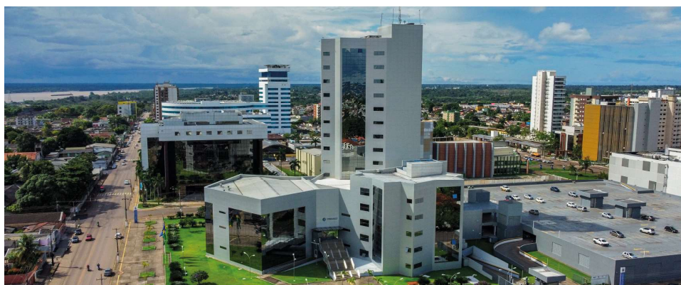
Evento será realizado no auditório da Casa

A palestra abordará tópicos como assédio moral, sexual e tipos de discriminação no ambiente de